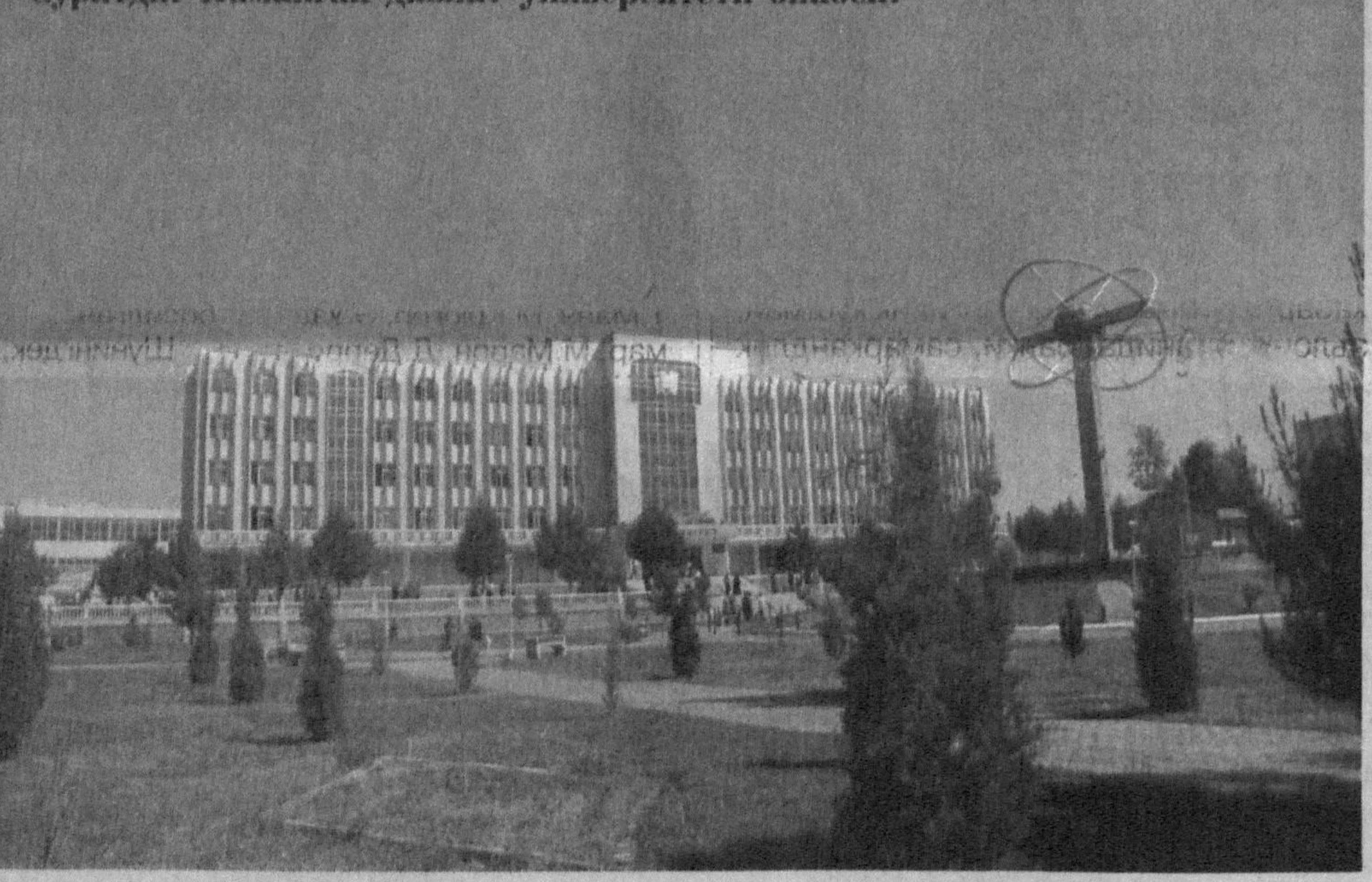
Суратда: Наманган давлат университети биноси.

ди. Қурилган иморатнинг қандайлигини билмоқчи бўлган одам уни... бузиб ҳам қўриши керак экан. Қарангки, ташқаридан бежирим кўринадиган қўлаб "қўлбола" қурилишлар биров дурустроқ "пуф" деса тўкилиб тушадиган даражада, эски-тускилардан ямаб-ясаб тилланган экан. Бугун уларнинг ўрнида шаҳарнинг умумий чирой-лаофатини тўлдирадиган, одамларга узок йиллар хизмат қиладиган иморатлар пайдо бўлди. Аввал бўлганидек, ота қурганини бола, бола қурганини набира бузмайди энди. Бир авлод қуради, ўн авлод яшайди.