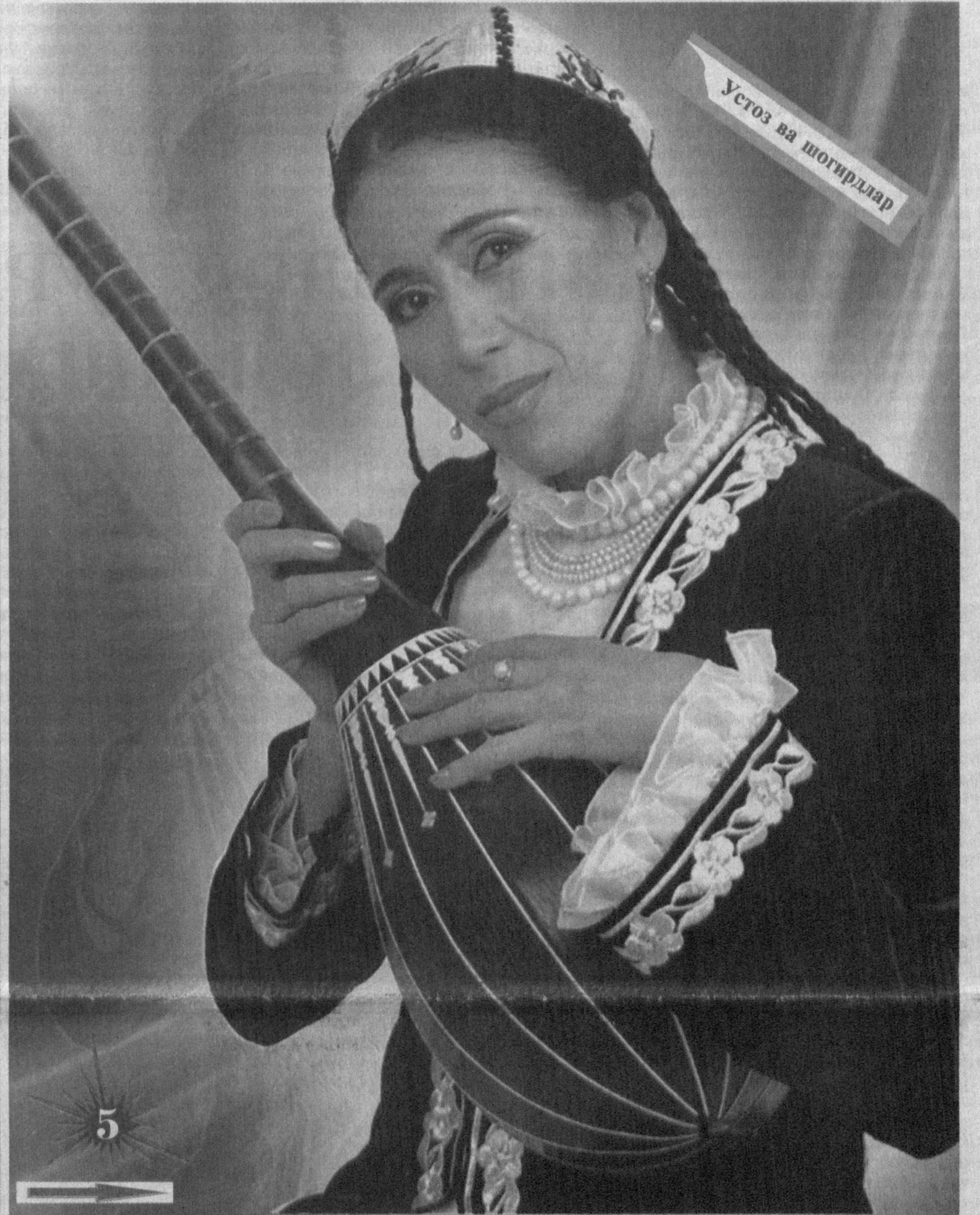
Устоз ва шогирдлар