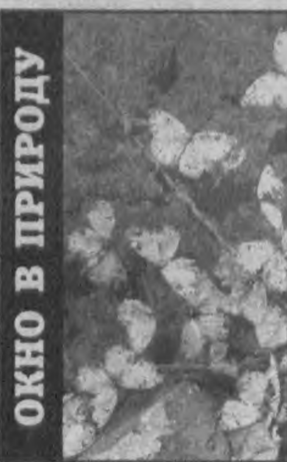
ОКНО В ПРИРОДУ