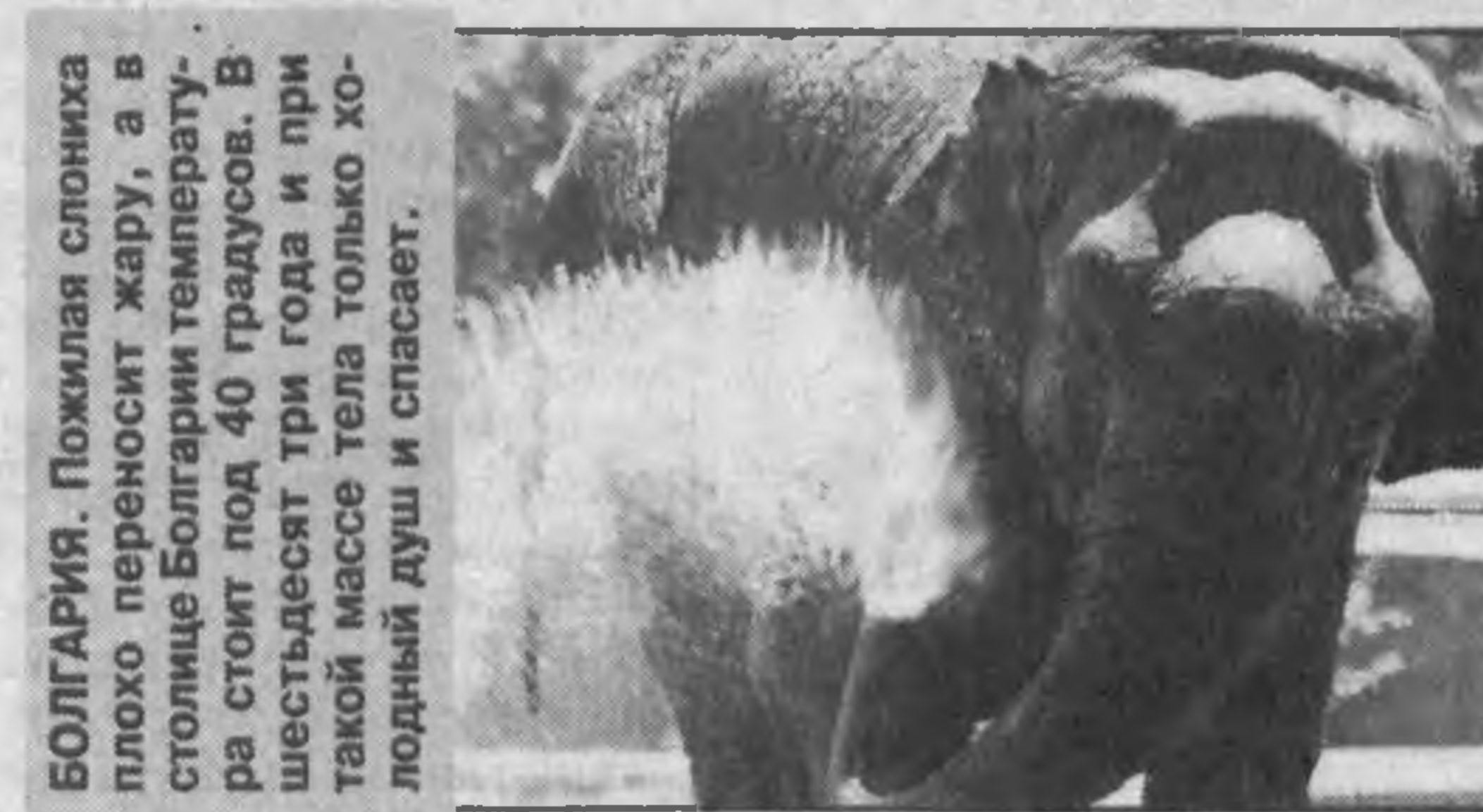
БОЛГАРИЯ. Пожарная спешка плохо переносит жару, а в столице Болгарии температура стоит под 40 градусов. В шестьдесят три года и при такой массе тела только людный душ и спасает.

Но это — исключение из правила. В целом же человечество оказалось перед новыми вызовами, на этот раз природными. И противостоять им можно лишь общими усилиями всех стран и народов.