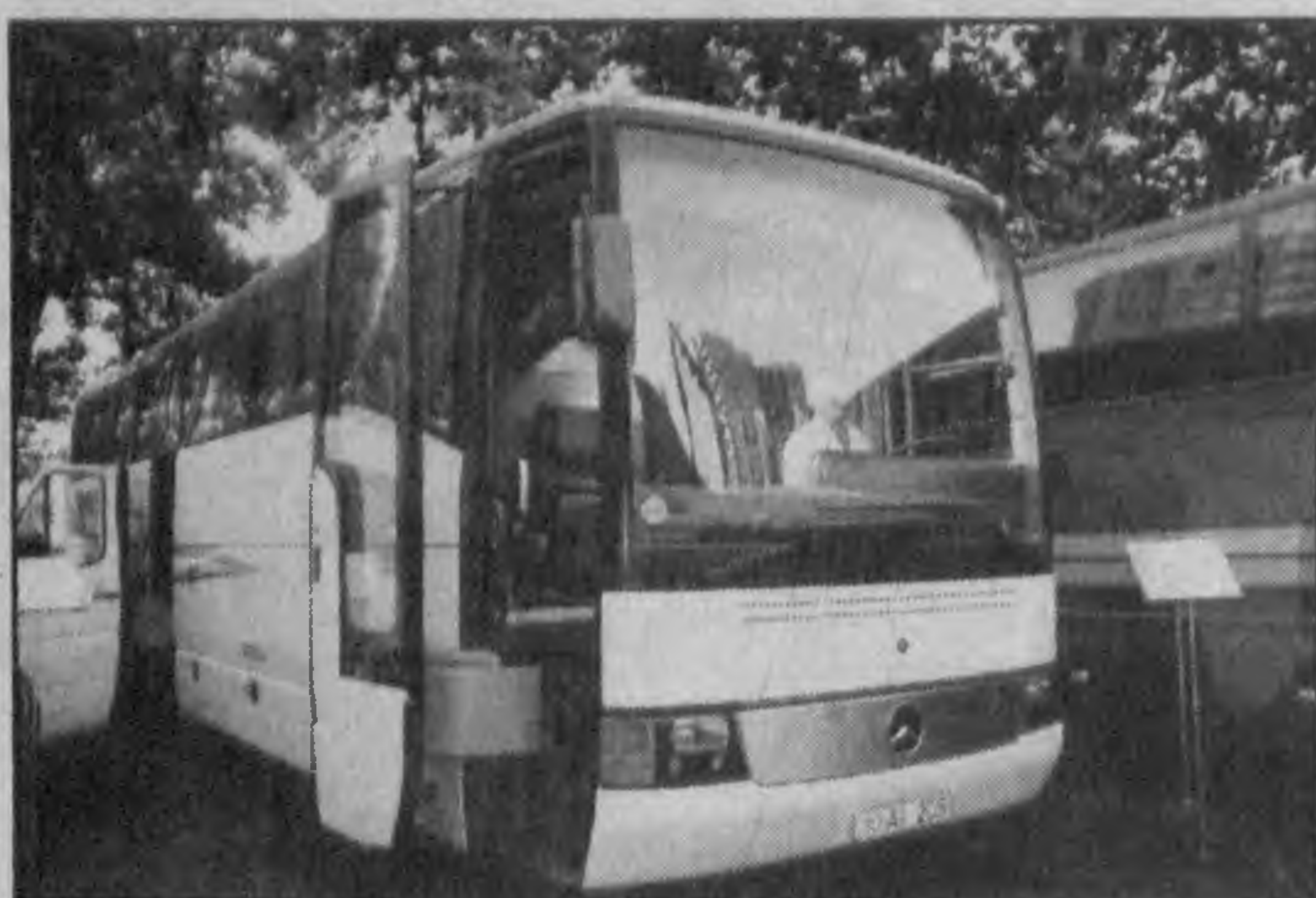
Абдувахид ХАТАМОВ, наш соб. корр.

Сейчас 65 процентов пассажирских перевозок Ташкента приходится на эти автобусы. И здесь сказались не только высокое качество машин. Созданный в столице центр сервисного обслуживания укомплектован необходимым оборудованием, квалифицированными специалистами. Вот уже восемь лет существует центр, и в течение всего прошлого времени возникающие вопросы эксплуатации решаются совместно с заводом-изготовителем, расположенным в немецком городе Манхайм. Здесь же прошли обучение водители, технический персонал, и теперь они в совершенстве владеют своей профессией. Именно поэтому имеющиеся 278 автобусов "Мер-