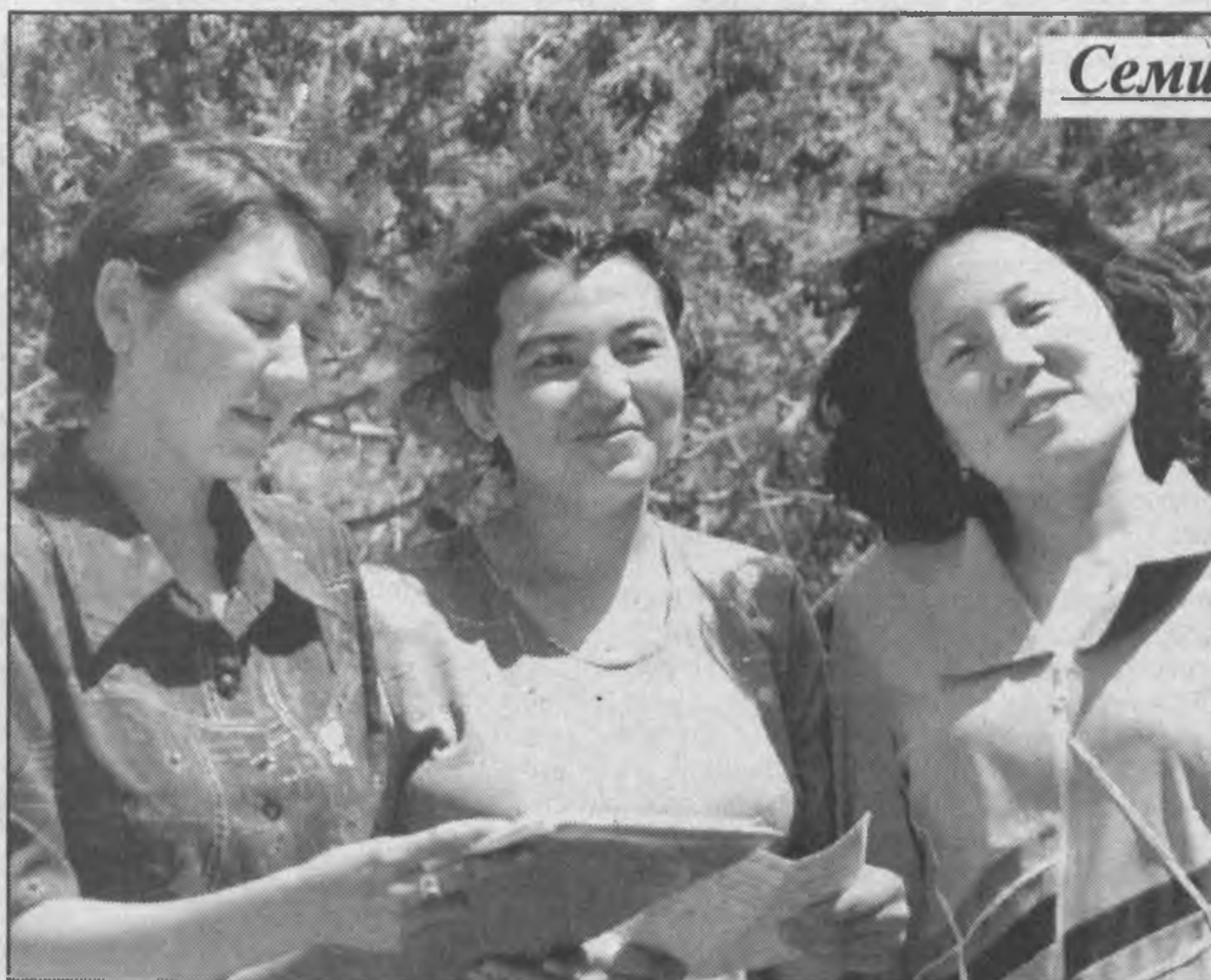
Семинар молодых талантов

В Зааминском районе Джизакской области в доме отдыха «Уриклисай» в течение трех дней проходил традиционный семинар молодых творческих сил республики, его цель — выявление новых талантов на литературном поприще. Как известно, семь лет назад этот семинар был организован по инициативе главы нашего государства. И теперь проводится ежегодно.