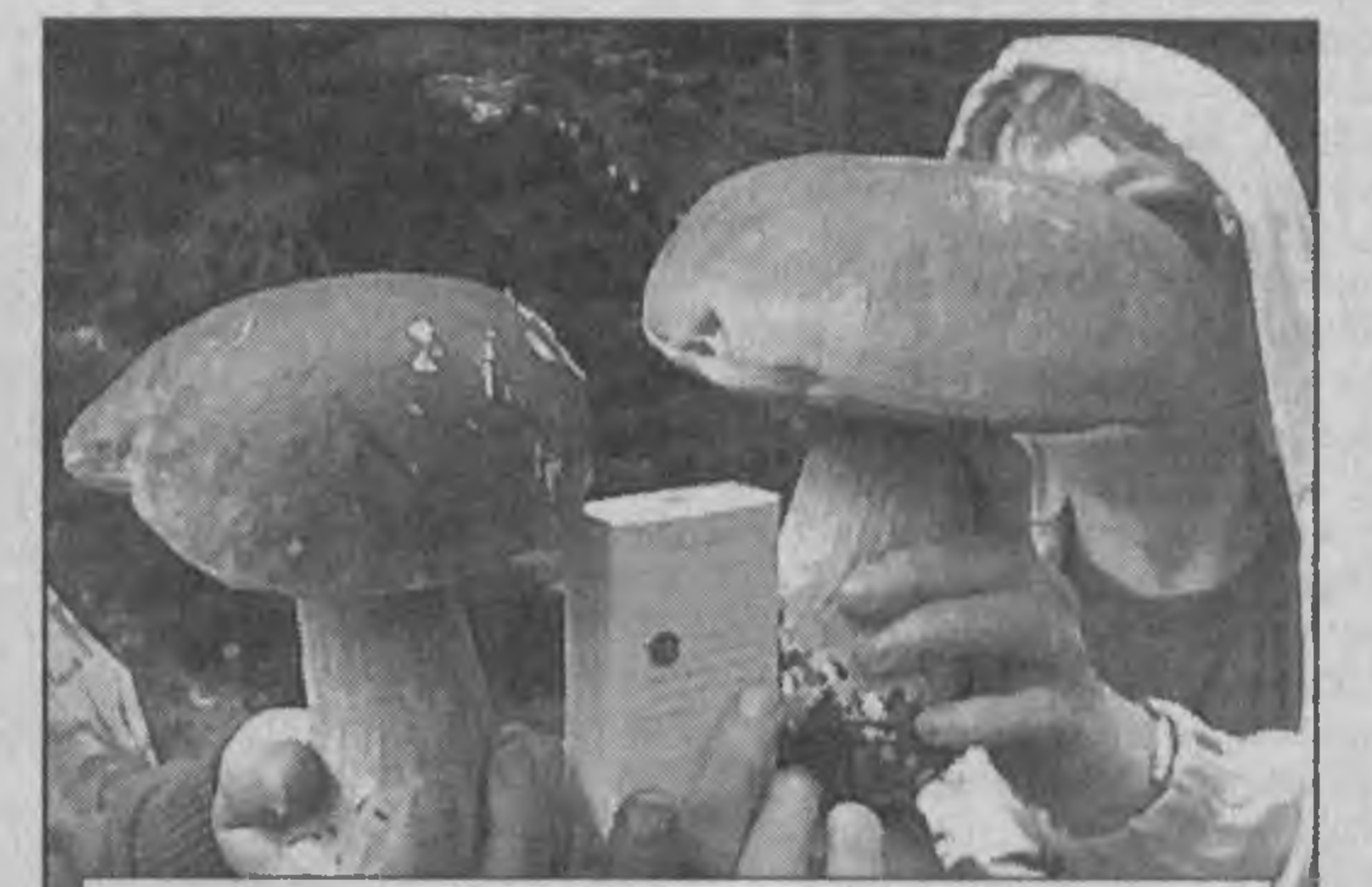
Россия. Грибы уродились просто сказочные этим летом — видно, сырой июль и жаркий июль прилипли им по вкусу. Причем не только на вид хороши, но и качество что надо — без единой червоточки.

Как заявил агентству Reuters пресс-секретарь Белого дома, президент доволен работой Колина Пауэлла и не собирается искать ему замену.