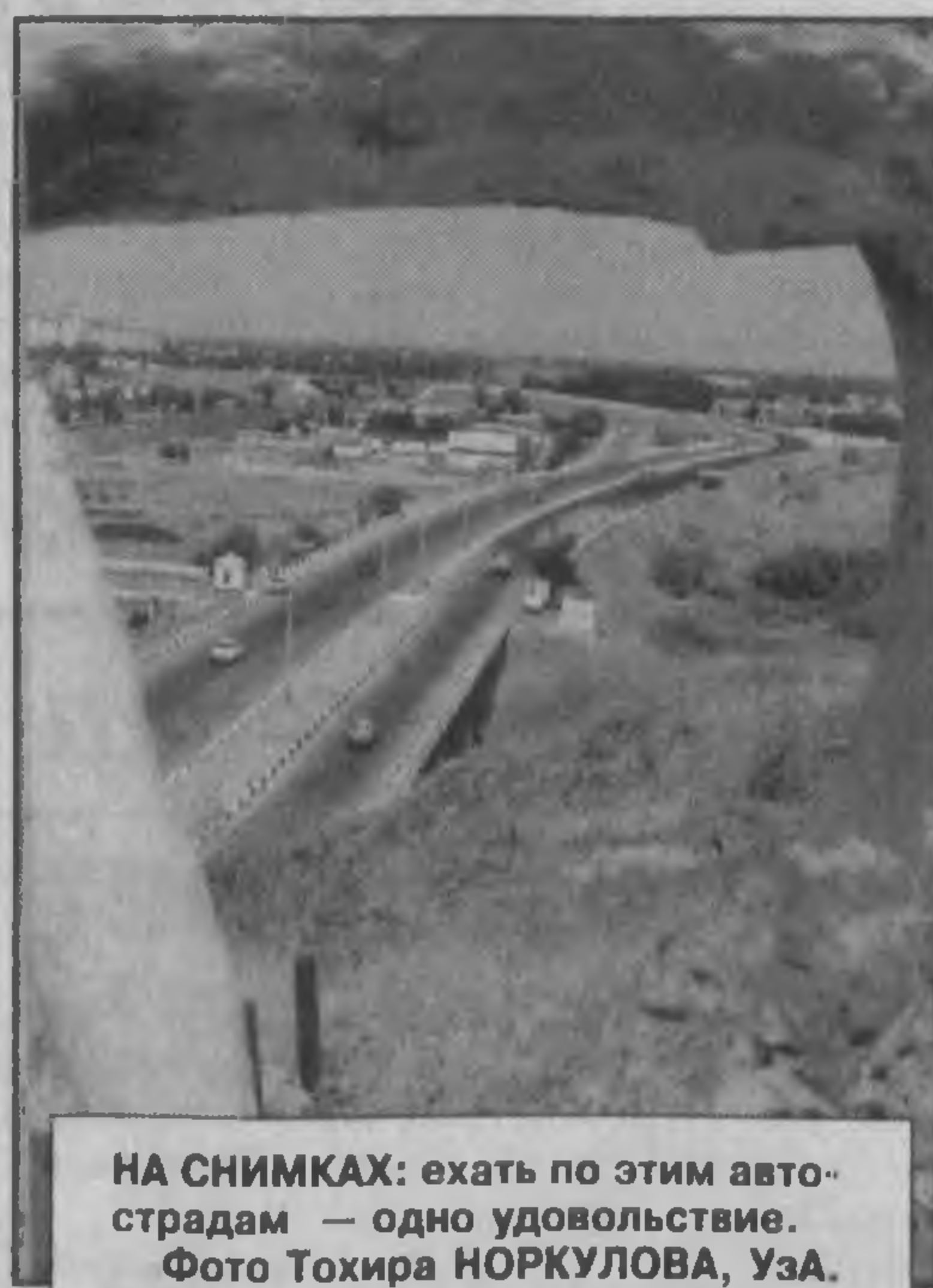
НА СНИМКАХ: ехать по этим автострадам — одно удовольствие.

Дороги, вернее, их состояние — это своего рода визитная карточка города, села, региона. Путешественнику со стажем достаточно проехать по какому-либо маршруту совсем немного, чтобы составить достаточно полное представление о состоянии доро-