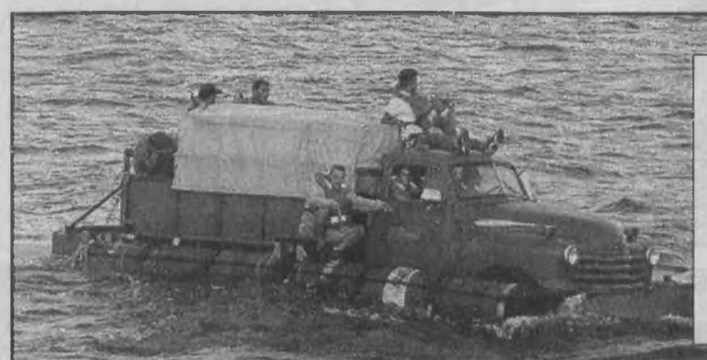
США. С острова Куба бежать можно и на грузовике — находчивые нелегальные эмигранты превратили его в плавсредство и умудрились доплыть до территориальных вод США, чем немало поразили береговую охрану.

жекторных двигателей V-8, работающих на газовом топливе, для иранской компании Zamyad. Помимо развития экспорта двигателей вторым важным для ЗМЗ направлением является развитие поставок за рубеж компонентов: уже в настоящий момент ЗМЗ реализует проекты по поставке сталеалюминиевой ленты производства ООО "ЗМЗ-Подшипники скольжения" в Турцию (годовой объем поставок оценивается в 200 тыс. евро) и по поставке сталеалюминиевого сплава в Израиль (годовой объем поставок оценивается в 300 тыс. евро).