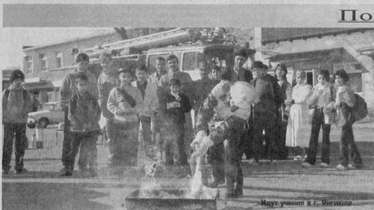
Идут учения в г. Янгйуле

Завершился Республиканский месячник пожарной безопасности, который традиционно вот уже несколько лет проходит по всей стране в особенно пожароопасное время года — осенне-зимний период. Так, в ходе проведенных мероприятий только в столице Узбекистана было выявлено более трехсот случаев незаконного использования газа, около шестидесяти — электроэнергии.