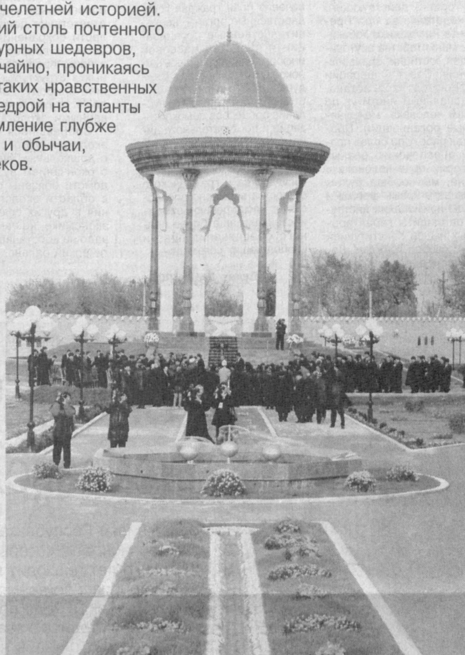
(Окончание на 4-й стр.)

Своими хан-атласами со струящимися радужными узорами и набивными тканями. По Великому шелковому пути торговцы возили его в Багдад, Кашгар, Хурасан, Египет и Грецию. Не случайно один из летописцев-историков того времени писал: «Один отрез маргиланского шелка стоит всех бухарских земель...»