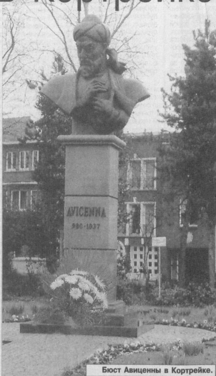
Бюст Авиценны в Кортрейке.

Рустам ШАГАЕВ, спец. корр. УзА. Фото автора.