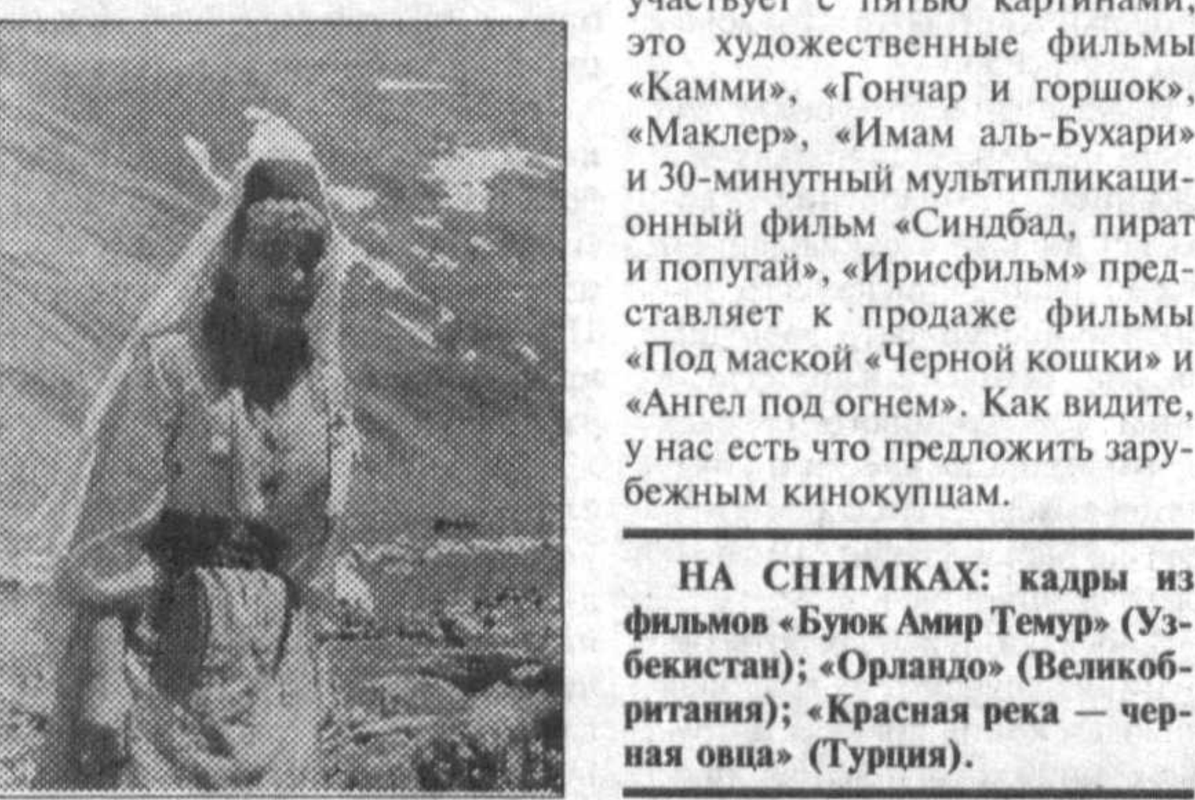
Улицы, носящие имя классика узбекской литературы Алишера Навои. Именно здесь, в районе Шайхантахур, в далекие двадцатые были созданы первые шедевры узбекского кинематографа...