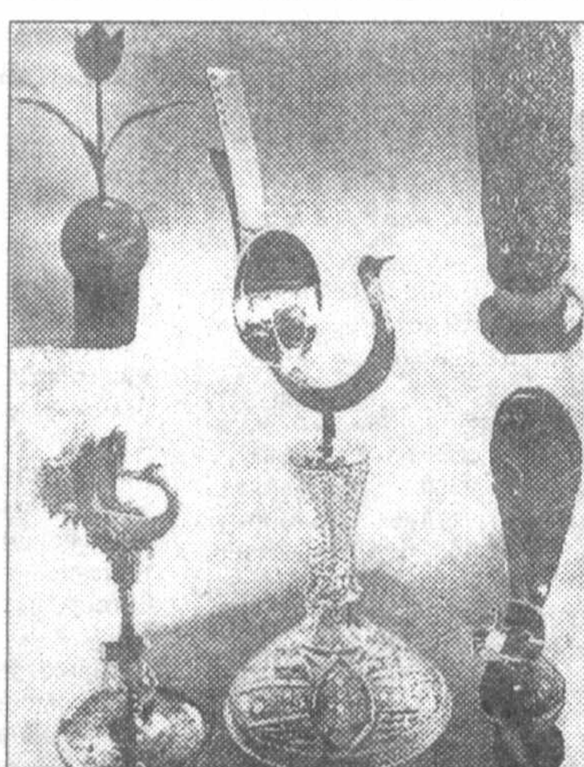
за возрождение и развитие национальной традиции в киноискусстве, «Золотая арча» — за лучшую мужскую роль, «Серебряный Семург» — за лучший дебют.