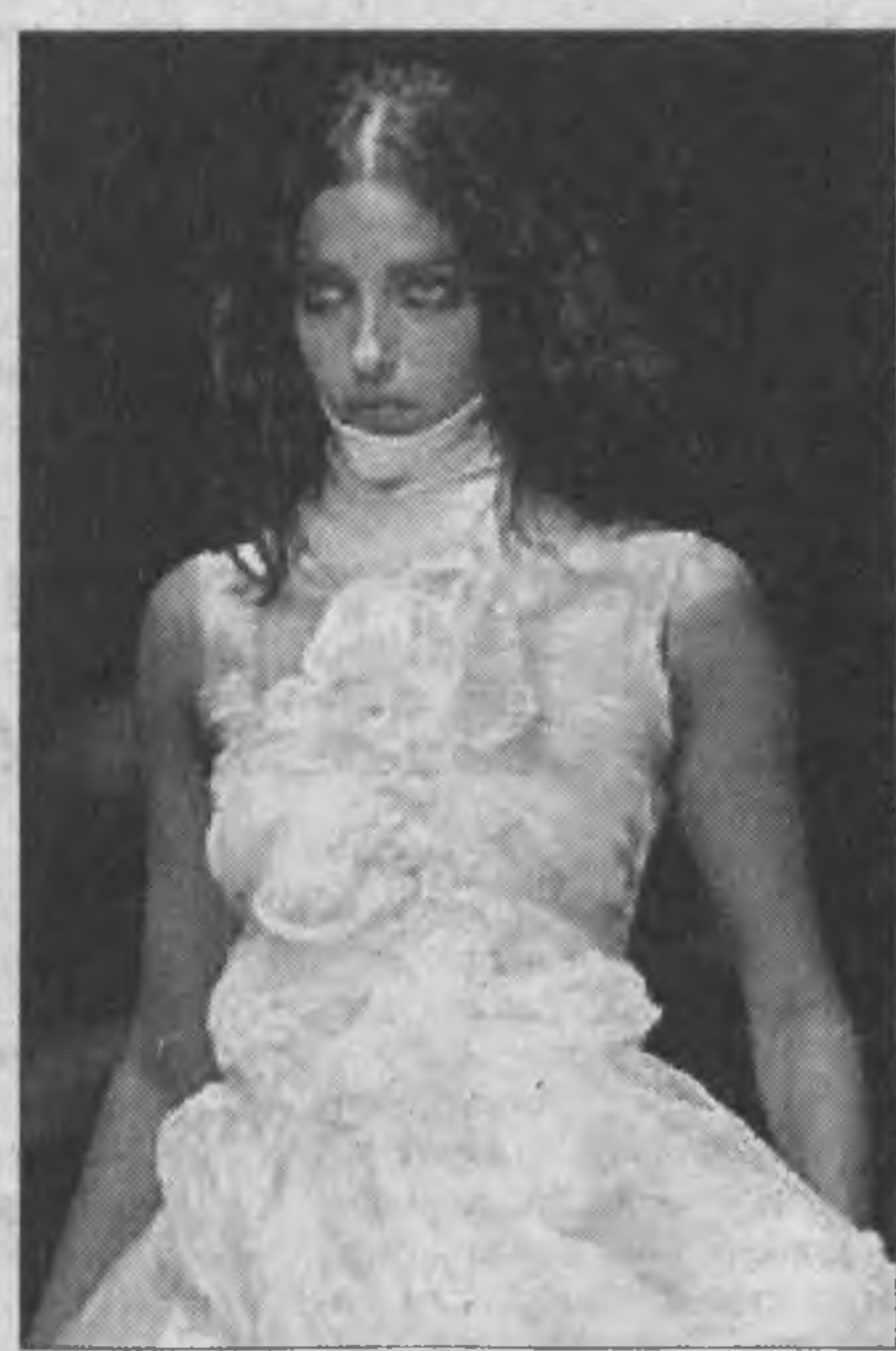
В Париже состоялась традиционная неделя моды, где на первый план вышли молодые модельеры.