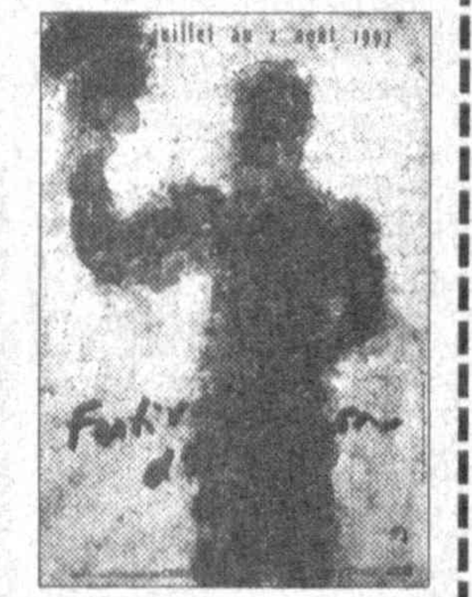
НА СНИМКЕ: афиша 51-го Авиньонского фестиваля.

По материалам зарубежных агентств и печати подготовил Александр КОСТЮНИН, корр. «Народного слова».