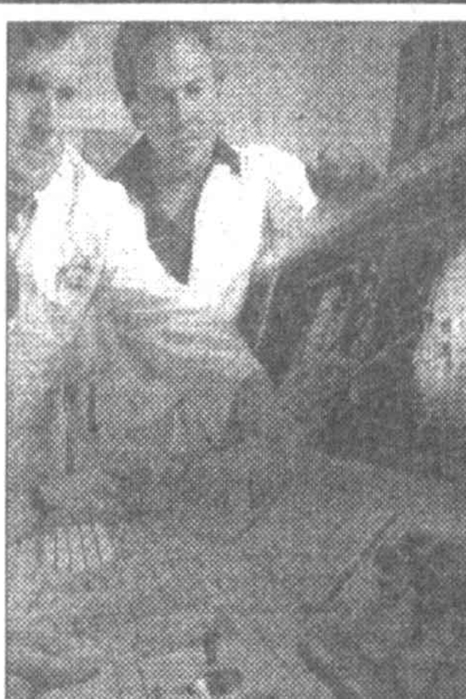
Новая методика распознавания и оперативного лечения раковых опухолей брюшной полости позволяет хирургам решать, есть ли вообще показания к операции по их удалению, а также точно определяет место нахождения опухоли.

В ней используется тепло человека в качестве электропроводника для передачи информации между двумя электронными приборами или двумя людьми. Технология, получившая название Personal Area Network (PAN), создает внешнее электрическое поле, пропускающее слабый ток сквозь тело, что и позволяет передавать информацию. Помимо прочих сфер применения, использование технологии PAN в телефонных автоматах и автоматических контролерах билетов позволит идентифицировать каждого пользователя на право пользоваться карточкой и кодом, что значительно снизит случаи мошенничества.