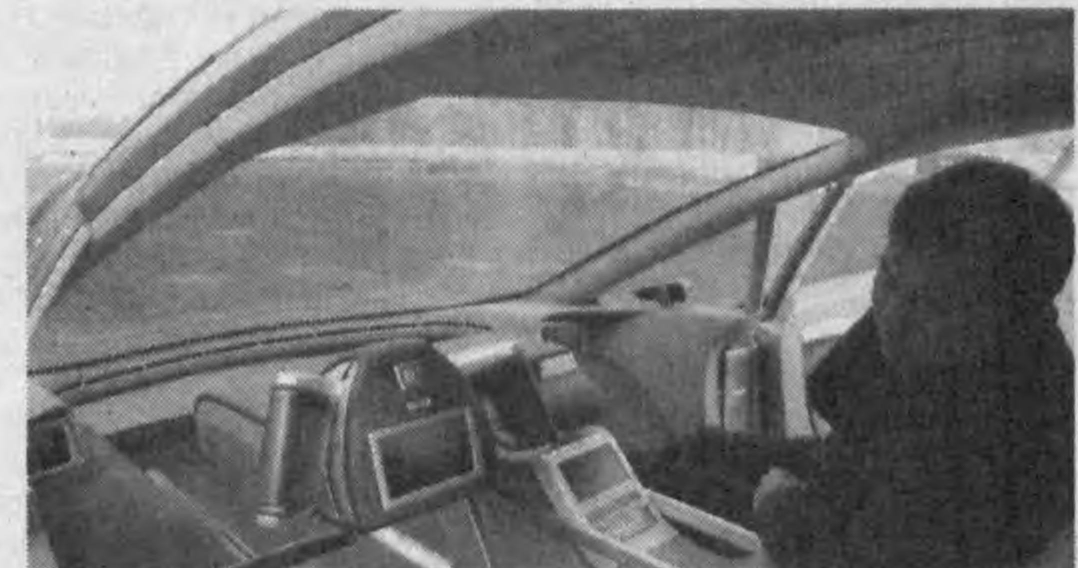
КИТАЙ. Джеренал Моторс показывает авто будущего китайцам — это, как-никак, сейчас самый перспективный автомобильный рынок. Концепт GM Hy-Wire не только отличается оригинальным дизайном, но и вместо бензина использует водородные топливные элементы.

В результате землетрясения на северо-западе Китая погибли по меньшей мере десять человек, сообщает телекомпания CNN. Пострадали еще 34 человека. По предварительным данным, землетрясением разрушено около 700 домов. Сила подземных толчков составляла 6,1 балла по шкале Рихтера. Наиболее пострадал округ Джаосу, расположенный на границе с Казахстаном. Reuters.