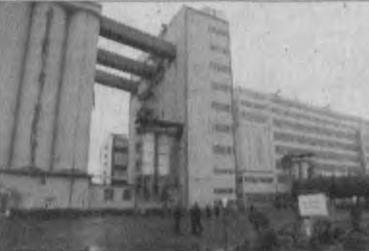
обслуживания, общественного питания, магазина, оздоровительный центр. НА СНИМКАХ: группа рабочих предприятия; общий вид АО зернопродуктов.

Биография действующего в Учкургане предприятия зернопродуктов восходит к апрелю 1986 года. Однако поворотным в его деятельности стал период, когда оно сменило форму собственности, став акционерным. Укрепилась его материально-техническая база, произвели смену устаревшего оборудования на новое, высокопроизводительное. Сейчас в АО работает около 530 человек.