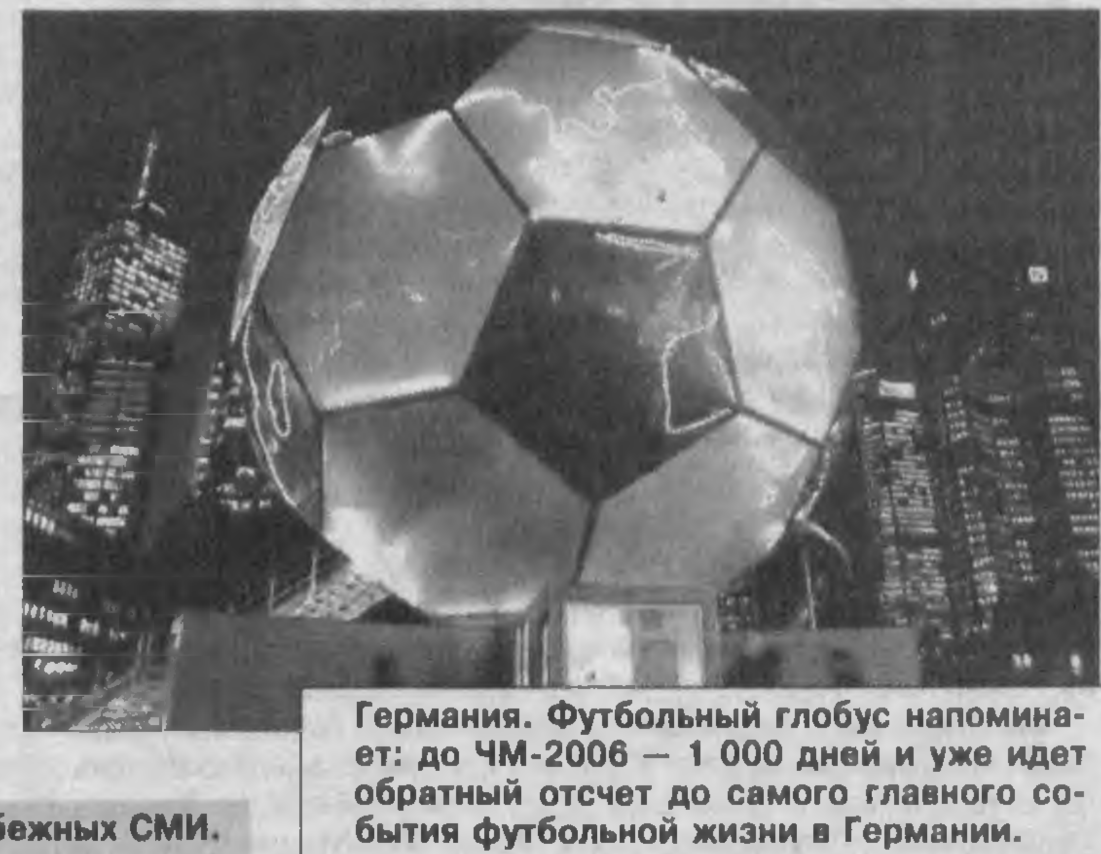
Германия. Футбольный глобус напоминает: до ЧМ-2006 — 1 000 дней и уже идет обратный отсчет до самого главного события футбольной жизни в Германии.

Согласно проекту бюджета на 2004 год правительство Японии планирует израсходовать на закупку ракетных комплексов около 100 млрд иен.