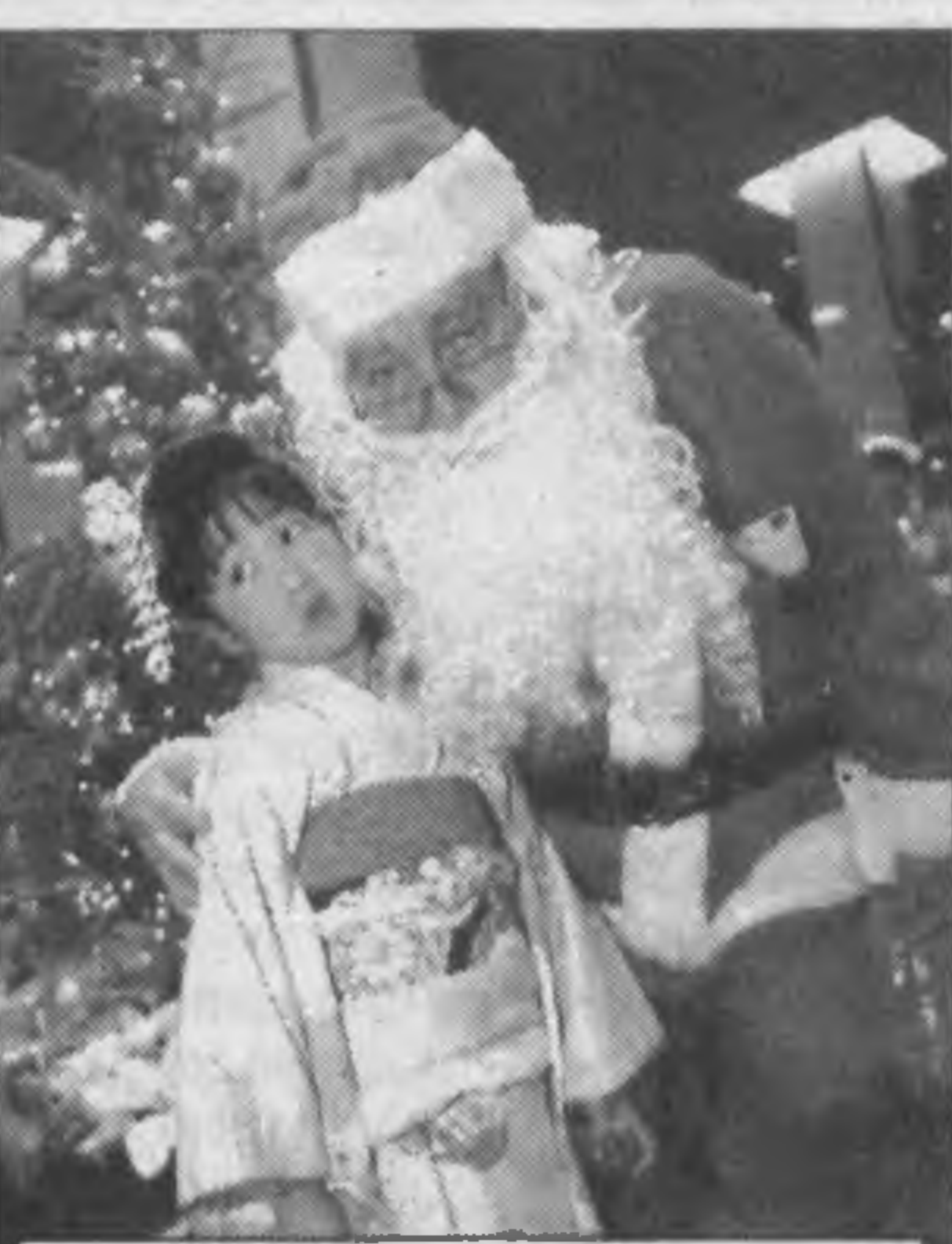
ЯПОНИЯ. Американские Санты прибыли в Японию с массовым визитом — более двух сотен добровольцев решили обеспечить рождественские радости японским деткам.

финансовых проблем штата облитации на сумму 15 млрд долларов, а также стоит ли устанавливать новые лимиты расходов статей бюджета.