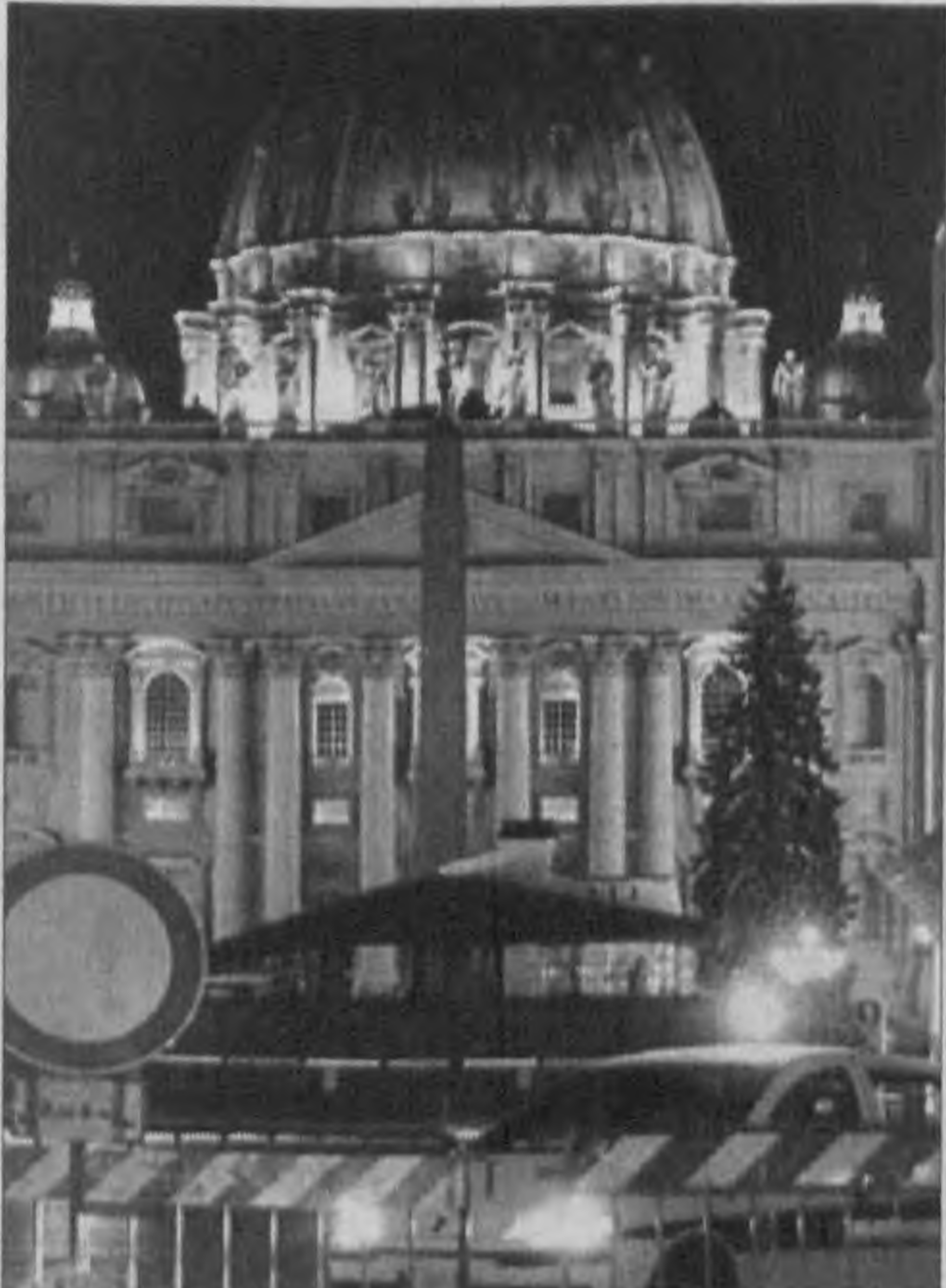
В Риме накануне Рождества были приняты дополнительные меры безопасности — ночью перекрыта дорога, ведущая в Ватикан.