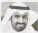
Абдулхадид аль-Аджди, декан факультета истории Кувейтского университета, профессор, доктор исторических наук.

Интерес общественно-политических и экспертных кругов зарубежных стран к Узбекистану, его динамичному развитию, происходящим демократическим процессам, в том числе предстоящим парламентским выборам, неуклонно растет. Об этом свидетельствуют мнения и оценки представителей иностранных государств, которые отмечают значительный прогресс в общественно-политическом развитии страны.