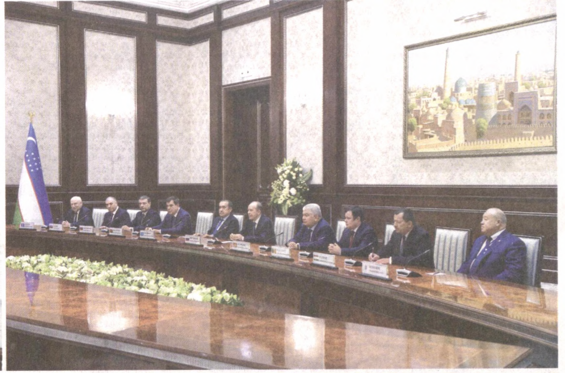
Президент Республики Узбекистан Шавкат Мирзиёев 7 ноября принял глав делегаций - участников ташкентского заседания Совета руководителей органов безопасности и специальных служб Содружества Независимых Государств.

Приветствуя гостей, глава нашего государства отметил придаваемое в Узбекистане важное значение расширению многоплановых отношений в рамках СНГ, в том числе в сфере