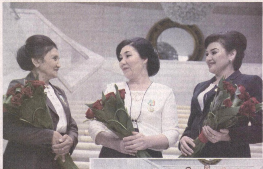
В столичном Дворце "Туркистон" состоялось празднование Дня медицинских работников.

В праздничном мероприятии приняли участие члены Сената, депутаты Законодательной палаты Олий Мажлиса, представители министерств, ведомств, общественных и международных организаций, врачи, медсестры, профессора, преподаватели, студенты, деятели культуры и искусства.