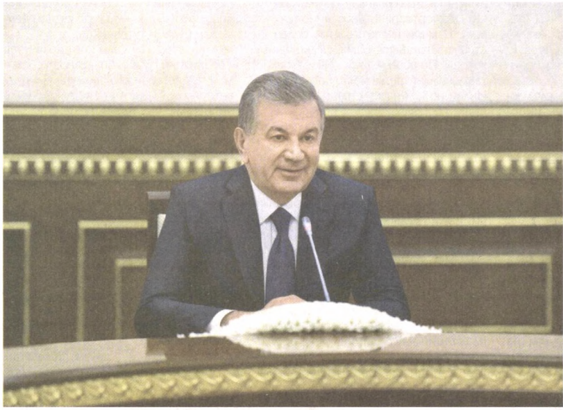
Президент Республики Узбекистан Шавкат Мирзиёев 13 ноября принял делегацию Азиатского банка развития во главе с президентом банка Такехико Накао, прибывшую в нашу страну для участия в мероприятиях Министерской конференции Программы Центральноазиатского регионального экономического сотрудничества.

В ходе встречи глава нашего государства выразил глубокое удовлетворение динамикой развития взаимовыгодных отношений с этим авторитетным международным финансовым институтом - ведущим и надежным партнером Узбекистана в