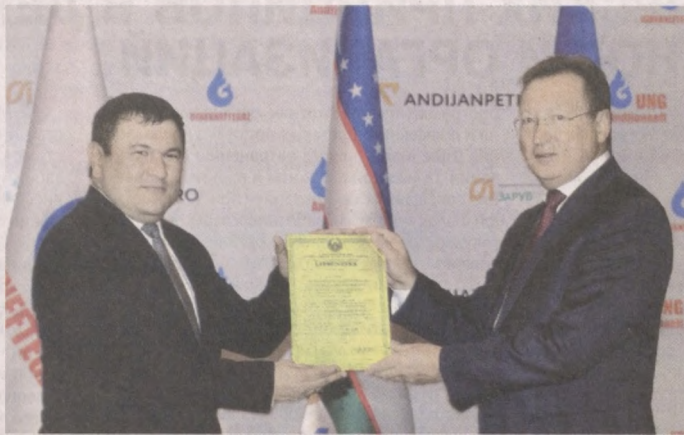
предусматривает обновление под- и наземного оборудования, анализ геолого-геофизических данных, оптимизацию системы добычи нефти.

Южный Аламышлик, Хартум и Восточный Хартум относятся к категории зрелых месторождений. Проект их разработки