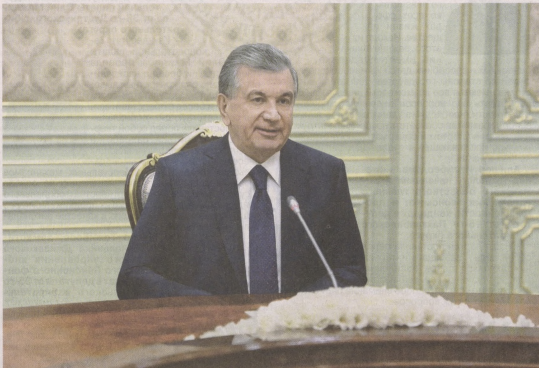
Президент Республики Узбекистан Шавкат Мирзиёев 12 декабря принял мэра японского города Нагоя Такаси Кавамуру.

Глава нашего государства отметил последовательное развитие узбекско-японских отношений дружбы и стратегического партнерства, расширение сотрудничества в политической, торгово-экономической, инвестиционной,