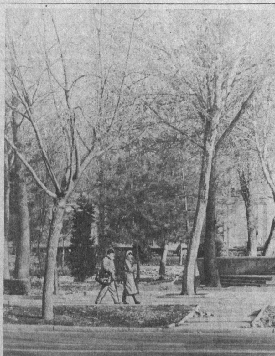
Дарахтлар, ҳаво иссиқлигига ишониб, уйғонмаг. Ҳали баҳор келгани йўқ...