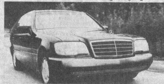
СУРАТДА: «Мерседес—Бенц 500 сел» седан услубидаги устки қошлама билан «супер» классидagi моделлар ичидagi энг машҳур автомашина ҳисобланади. 1990 йили АҚШда бу марказдаги автомобиллардан 78.375 донаси сотилди.