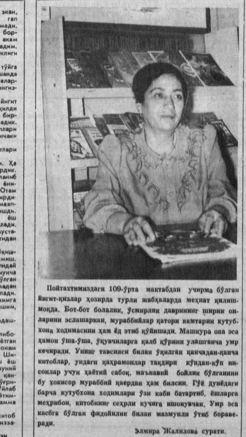
Поитяхтинимиздаги 109-ўрта мактабдан учирма бўлган йигит-қизлар ҳозирда турли жабҳаларда меҳнат қилишмоқда. Бот-бот болалик, ўсмирлик даврининг ширин оларини эслашаркан, мураббийлар қатори каттарини кутубхона ҳодимасини ҳам ёд этиб қўйишади. Машқура она эса ҳамоно уша-ўша, ўзуқуварига қалб қўриши улашганча умр кечиради. Унинг тавсислени билан ўқилган қанчадан-қанча китоблар, ундаги қаҳрамонлар тақдирини кўнгал-кўп ишонилар учун ҳаётни сабоқ, маънавий бойлик бўлганини бу ҳонсор мураббий қардан ҳам билсин. Гуё дунёдаги барча кутубхона ходимлари ўн қаби батартиб, ёшларга меҳрибон, китобнинг сеҳрли кучига ишонувчан. Умр эса қасаб бўлган фидойиллик билан маъмули ўтиб бораверади.