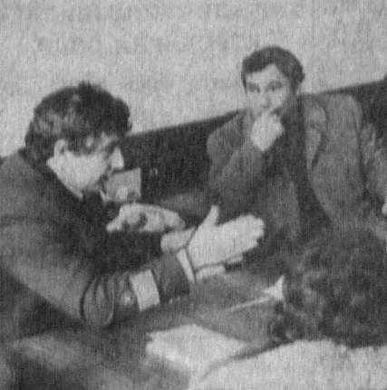
Кавказоити темир йул транспортининг аҳоли мушкул. Москва — Ереван йўловчи составлари Озарбайжон темир йули бўйлаб юришдан бош тортмоқдалар. Ҳозирда поезд бригадалари Крас-