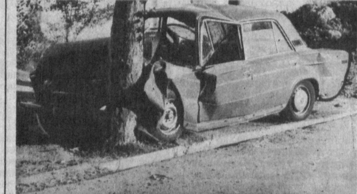
Спиртли ичимлик ичиб рул бошқаришнинг оқибати доимо мана шундай вай бўлади.

Қўлимда 1991 йилнинг ўтган 12 ойи мобайнида Тошкент шаҳрида содир бўлган йўл-транспорт ҳодисалари таҳлилининг асосий ваари турбиди. Келинг, унга биргаликда рази соламиз.