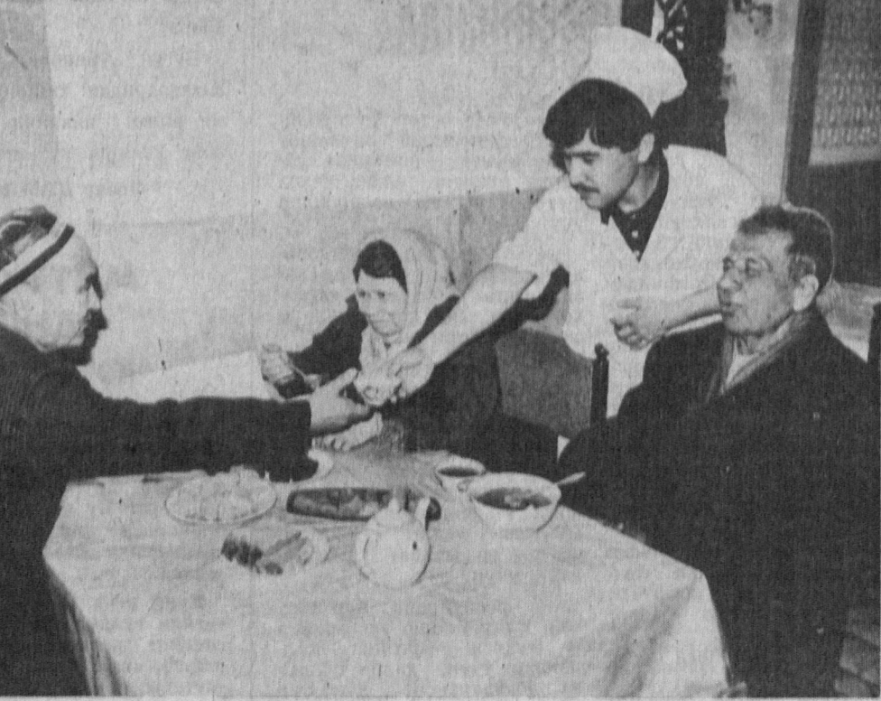
Сиз суратда кўриб турган кесалар Ўзбекистон Республикаси Қизил Ярим ой маданиятининг меҳр-мурувватидан баҳраманд бўлишайпти. Биргина булар эмас, жамият томонидан пойтахтимизда яшайтган 15-20 нафар меҳнат фахрийлари, боқувчи-

янги йил байрамига таъйиргарлик кўра бошлади. Бу ерда арчага осилдадиган кичик чироқ шодалари ишлаб чиқариш яна бошланди. Олдин бундай маҳсулот сифатига эътирозлар кўп эди. Энди улардан фойдаланиш хусусиятлари яхшиланди, чироқ шодаларининг юз соат ишлашига нафолат прилади.