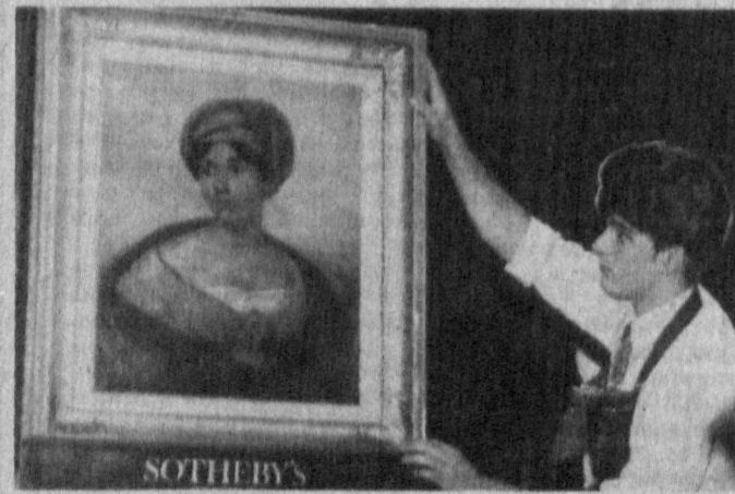
ЛОНДОН. Француз расоми Делакруаннинг «Аёл портрети» сурати кия ошди савдосида бир нотинч харидорга бир миллион 407 миғ 600 долларга сотилди. СУРАТДА: кия ошди савдосида сотилган Делакруа ишлаган сурат.

ТЎХТОВСИЗ КУЛГИ БИЛАН ● ДЕҲЛИ. Индуизм негизинда ташкил этилган янгиланган дин-ошога эътиқод қилувчилар жамоеси вақили бутун дунёда 750 та марказда янги йилни кутиб олишнинг «Умумжаҳон» нотижаларини маълум қилди. Ошога эътиқод қилувчилар 1 январь бошланишини 30 минут давоминда тўхтовсиз кулгу билан нишонлашга ақд қилдилар. Худди шундай ҳам қилишди. Ҳиндистонда жамоенинг Пуна шаҳридаги бош марказида 5 минг киши — асосан Ғарбий европаликлар ярим соат ҳаёло-лақ қилди. Германиядаги маросимда ҳам шунча одам, АҚШда 3 минг киши, Италияда 2 минг киши қатнашди. Байрам ташкилотчиларининг фикрича, кулгу кайфиятини яқшиллабгина қолмай, селоматликни ҳам мустаҳкамлайди. Ҳозирги нотинч дунёда ҳар некаласи ҳам муяда муҳим. Пунадаги маросимини ўз йўли билан кўрганларнинг айтишларича, оломонини қувонтириш учун бир неча ҳазилни айтиш киғоз қилди. Сўнгра одамлар бир-бирларига қараб ўзларини кулгудан тия олма қолдилар.