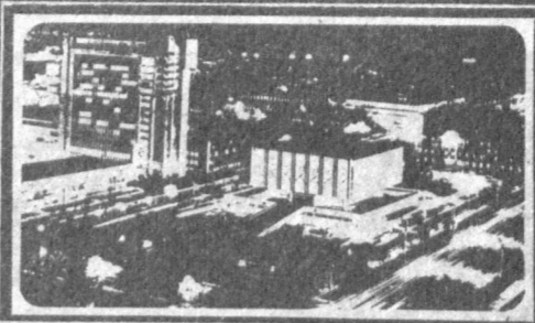
Ўзнома 1966 йил 1 июлдан чиқа бошлаган