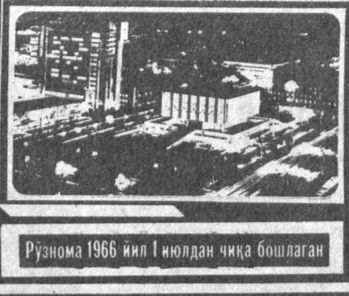
Рўнома 1966 йил 1 июлдан чиқа бошлаган

№ 63 (8. 005) 1992 йил 30 март, душанба Нархи 1 сўм.