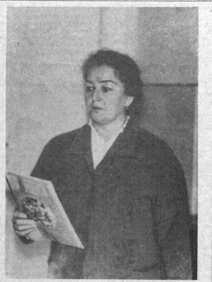
Сиз суратда кўриб турган аёл муаллимлик фаолиятини бошлаганида эндигина 20 ёшга тўлган. Навқиронликнинг ўли ҳақидаги хабарларни эшитиб қайнаган ҳолатда унинг жабҳаларида меҳнат қилишга...

Курбонали ТОШМАТОВ, Оқтөб раён халқ судининг раиси.