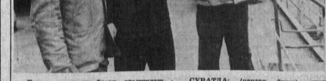
Тошкент иссиқлик билан таъминлаш маркази ишлаб чиқариш бирлашмасининг 4 бўлинмасида юқори қувватли иссиқлик узаткичлар ўрнатилган. Шунинг учун ҳам бу ерда ўз касбининг усталари меҳнат қилишади.

СУРАТДА: (чапдан ўнгга) ишчи Игорь Литвинов, смена бошлиғи Эркин Исроилов, ва катта машинист Аҳмад Рашидовлар иссиқлик босимида назоратдан ўтказмоқдалар.