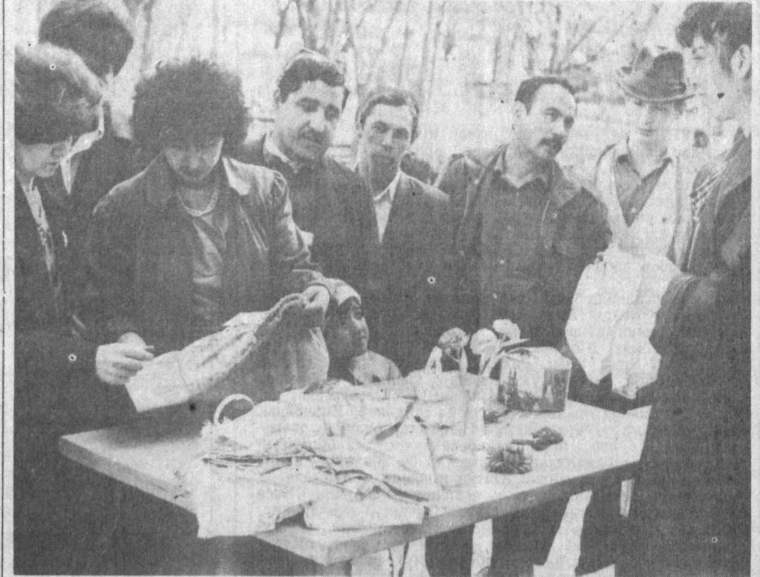
ШАҲРИМИЗНИНГ Октябрь районида мактабларро ўқув-шўба қилариш қўмиталари, кашофлар уйлари ва техника станциялари фаолият қўришда...

бонийхон ҳам Темурадк шахс бўлиш учун кўп ишлар қилган. У ҳам катта мақбара қуришни ният қилган.