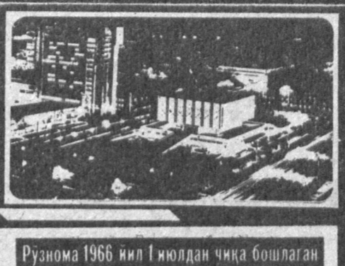
Рузнома 1966 йил 1 июлдан чиқа бошлаган

№ 75 (8. 017) 1992 йил 16 апрель, пайшанба Нархи 1 сўм 50 тиғин