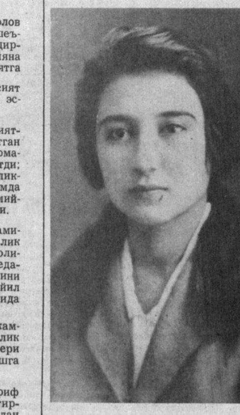
Хосият Тиллаҳон қизи

бахт учун, ўз қадриятларимиз ҳимояси учун даҳшатли бир қавллик билан ижод қилган, замон галамисликларига мардонавор бардош берган ҳолда қалам сурган шоиранинг қалбиде нодисо ёзма нутқимизда зарб этилиб, бир умр қолдирилди. Шунисиға ҳам раҳмат! У педагогик, журналистик ҳамда ижтимоий-сиёсий иш фаолияти давомида ўзбек миллий маданияти — шерьияти, педагогикаси, журналистикаси соҳасида бир дунё ётгорлик қолдирди. Унинг 15 ёшлиғида «Интилиш» (1922), «Уйғонин» (1923), «Ёруқ ойга» (1923) ҳамда «Қўтлаш» (1926), «Ўртоғим овози» (1926) каби ўндан ортин гоғий пухта, бадиий баркамол шерьлари эълон қилинди.