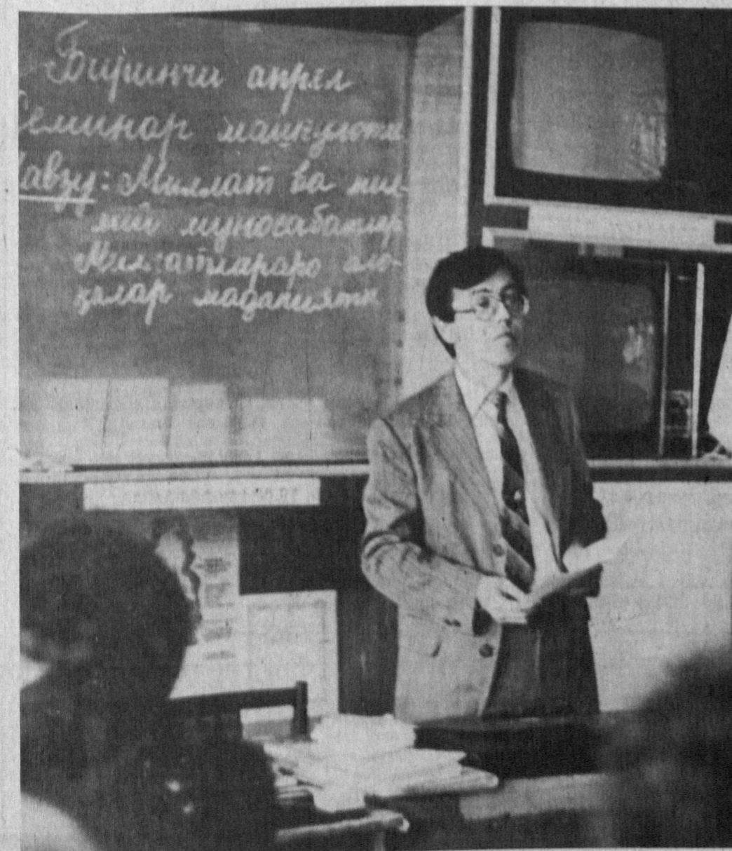
Суратларда: семинар кенгаши пайтида.