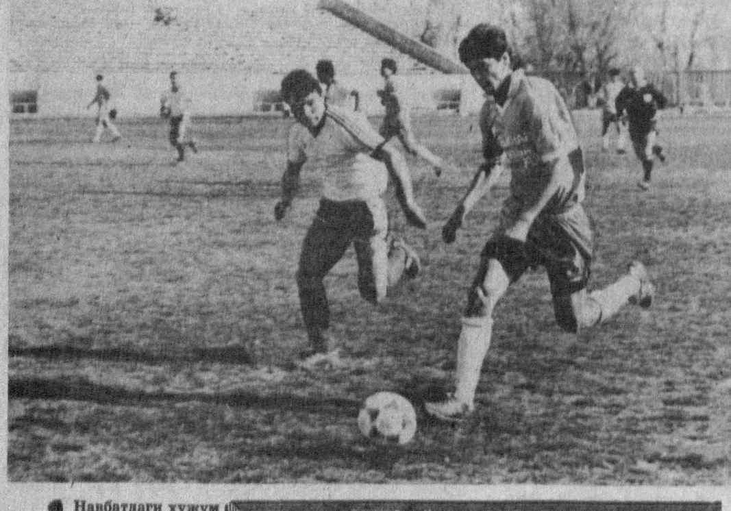
Навбатдаги ҳужум қандай яқинларини... Мухаррир Эркин ЭРНАЗАРОВ.