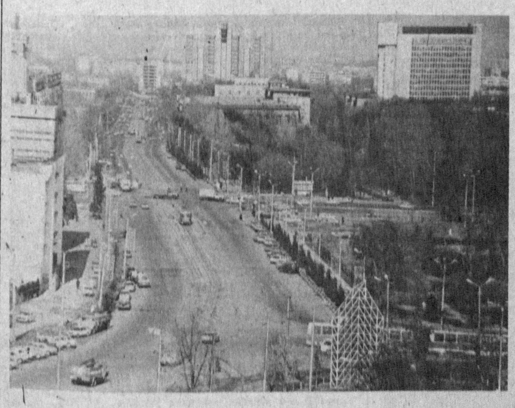
БУТУНГИ ТОШКЕНТ. Шароф Рашидов йўчасининг бутунги қўришини.