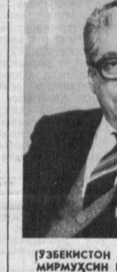
ЎЗБЕКИСТОН ХАЛҚ ЁЗУВЧИСИ МИРМУХСИН БИЛАН СУХБАТ.

— Романда Жалолиддинга кам ўрин ажратилган. Бу иккидй заруратиди ёки аслида ҳам шундай бўлмади.