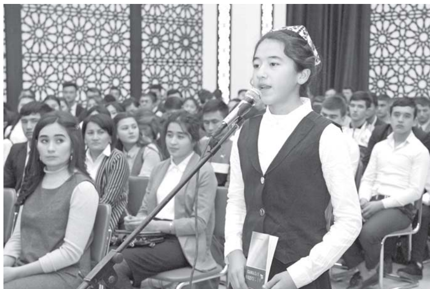
Энергия молодых будет содействовать реализации инновационных проектов. Они призваны стать генератором новых идей и подходов.

Особое внимание на мероприятии было уделено вопросам образования,