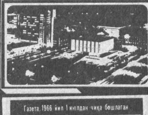
Газета 1966 йил 1 июлдан чиқа бошлаган

№ 12 (8. 210) 1993 йил 20 январь, чоршанба Нархи 5 сўм