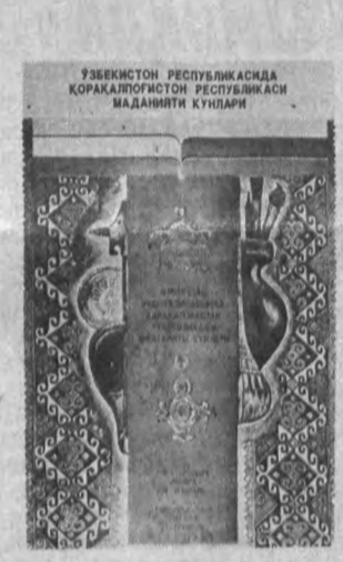
Узбекистон Республикасида Қорақалпоғистон Республикаси Маданияти Кўлиби

Шахримиздаги 262-мактабнинг 40 тадан ортик ўқувчисига Ёшлар Иттифоқи аъзолик билетлари топширилди. Яна оммавийликми, дейсизми? Ҳа, оммавийлик. Лекин бошқачароқ. Мактабнинг юқори синф ўқувчилари жамоат ишларига жуда ҳам қизиқишади. Уларда «Амир Темур», «Бобур» деб номланган иккита гуруҳ маъмури бўлиб, гуруҳлар бобонаполларининг пухта ва фаолиятларини ўрганади ва тарғибот этади. Янгида улар Ёшлар Иттифоқига аъзо бўлиш истегини билдиришди. Бундан ташқари ўз ташаббуслари билан Ёшлар Иттифоқи аъзоси қасамеддини (ҳали ҳеч қачонда бўлмаган ҳол) қабул қилишди. Ёш ташаббускорларини Ўзбекистон Ёшлар Иттифоқи Шайхонтоҳур район қўмитети котиби Хайдар Бобохов таърифлади ва раъвономиядан эсадалик савоблари топширди. Бугунга келиб район Ёшлар Иттифоқига аъзоларнинг сони 7 миңдан ошиб кетди.