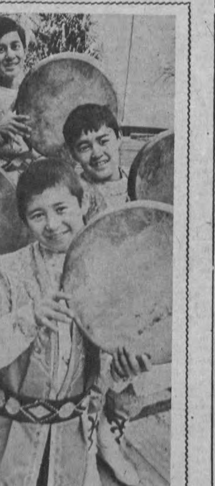
Одам зоти куйсиз, кўшиқсиз бирор лаҳза яшай олармикни! Чилдирманнинг гижбани, танбурининг нолакор садолари юракларга худди симобдек қуйлиб, бугин-бугинингача итратиб юборганда куйнинг қадрини билар экансанкиши. Ана шунда бөхтиёр ўйлаб қоласан: саянь бу инсонга жон ўриндаги малҳам экан. Балки шундандир гармонини завқ билан чалаётган созанининг юзидидаги хушбахт табассум!!