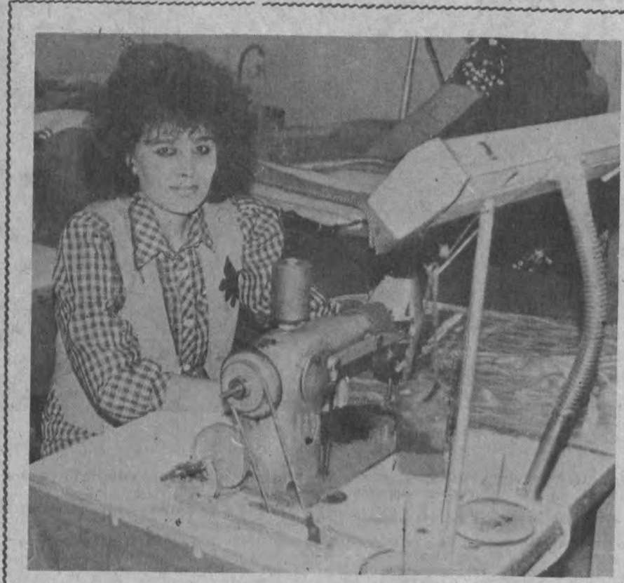
«Ташгоршвейбт» ишлаб чиқариш бирикмасига қарашли 2-тикус устaxonаси бундан бир йил олдин жарағат ўтиб, катта ютуқларни қўлга киритмоқда. Утган вақт ичида меҳнат унумдорлиги анча ошди. Мақсуд цехда буюртмалар бежирим

Органик кимё институтида Я. М. Паушкин бошлиқ олимлар гуруҳи то-