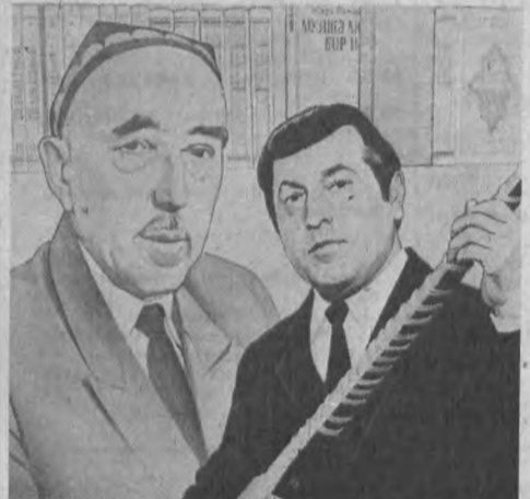
— Ражабийхонликнинг ўтказилиши аввало ўзбек халқ мусиқа меросининг, шу соҳада излаган барча алломаларининг, ҳофизу соҳнада устозларининг, қолаверса мумтоз шоирларининг, шеъринингизга нисбатан ҳурмат ва эҳтиромининг яна бир бор ифодалани. Бундай анжуманлар келгусида ҳам мунтазам ўтказилиб турилса ўтиб кетган устозларининг руҳи покларини шод этишга, уларга келаятган авлодларнинг мусиқа меросининг, умуман, маънавий қадриятларининг муносабатлари яқинлаштириб, муҳаббатларини орт-қаришига катта ҳисса қўшган бўлар эди. Ражабийхонлик бу йил биринчи марта нишонлангани боис баъзи ташкилий намчиликлардан ҳоли бўлмаганлигини айтмасак, умуман яхши таассурот қолди. Шунинг учун бу анжумани ўтказишда яқиндан ёрдам берган мутасаддиларга, сўзга чиққан барча маърузчиларга, барча қатнашчиларга Ражабий сулоласи номидан чуқур миннатдорчилик билдиришни қара деб биламан.

— Анжуманда Сиз ана шу ул аллома — Ражабийлар ҳақида тўқчиланиб сўзлагиниз. Айниқса, раҳматлик Юнус Ражабийни хотирлаб: