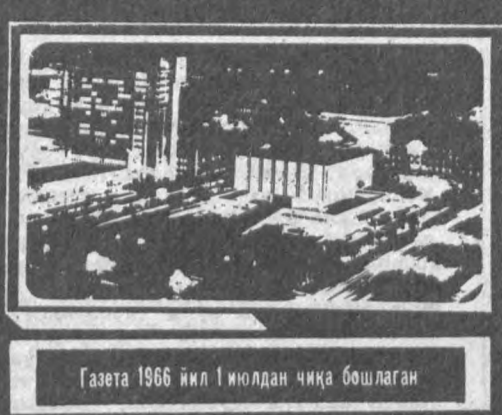
Газета 1966 йил июлдан чиқа бошлаган