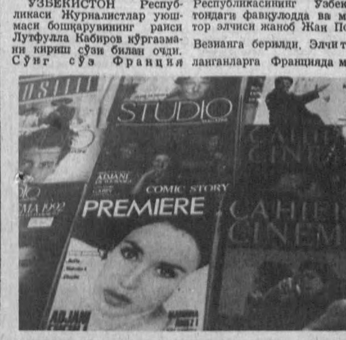
Ўзбекистон Республикасининг Ўзбекистондаги факультет ва мухтор элчиси Жан Поль Везинага берилди. Элчи тўғрисида маълумотлар Францияда тантанали равишда таъинланди.

Кеча Тошкентдаги Журналистлар уйи пойтахт оммавий ахборот воситалари раҳбарлари, журналистлар билан гап-суҳбат бўлди. Бу ерда Франциянинг Ўзбекистондаги элчихонаси ҳамда Ўзбекистон Журналистлар уюшмаси томонидан ташкил этилган Франция матбуоти тарихига бағишланган кўрғазманинг таштанали очилиши маросими бўлди.