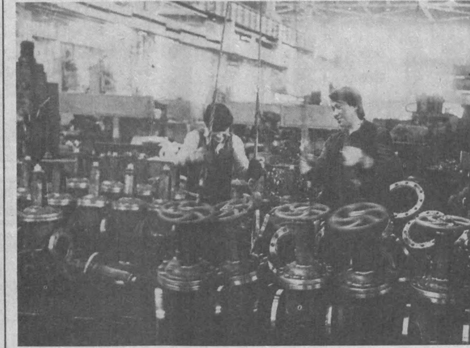
«Иргидромаш» таърифи ишлаб чиқариш бирлашмаси пойтахтнинг кенжа корхоналаридан ҳисобланади. Ҳўзирги кунда бирлашмада республикамиз халқ хўжалиги учун аэроур бўлган ускуна ҳамда дастгоҳлар ишлаб чиқарилаётган. СУРАТЛАРДА: корхона цехларидан бирининг