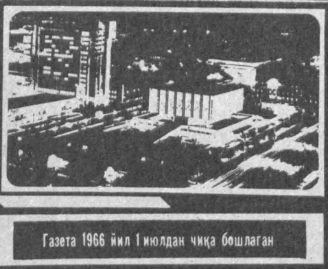
Газета 1966 йил 1 июлдан чиқа бошлаган