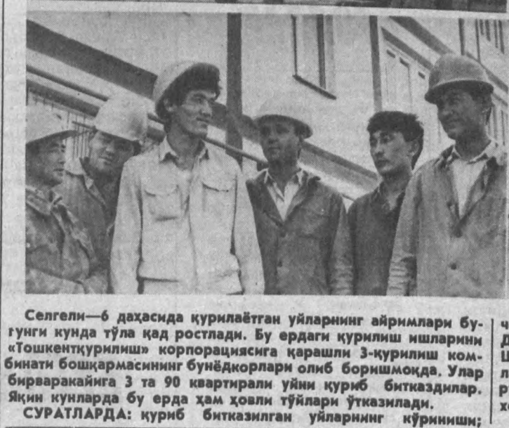
Селгели—6 даҳасида қурилайтган уйлارнинг айримлари Бугунги кунда тўла қад ростлади. Бу ердаги қурилиш ишларини «Тошкентқурилиш» корпорациясига қарашли 3-қурилиш компанияси бошқармасининг бунёдкорлари олиб боришмоқда. Улар бирварақайга 3 та 90 квартиралли уйни қуриб битказдилар. Яқин кунларда бу ерда ҳам ҳовли тўйларни ўтказилади.