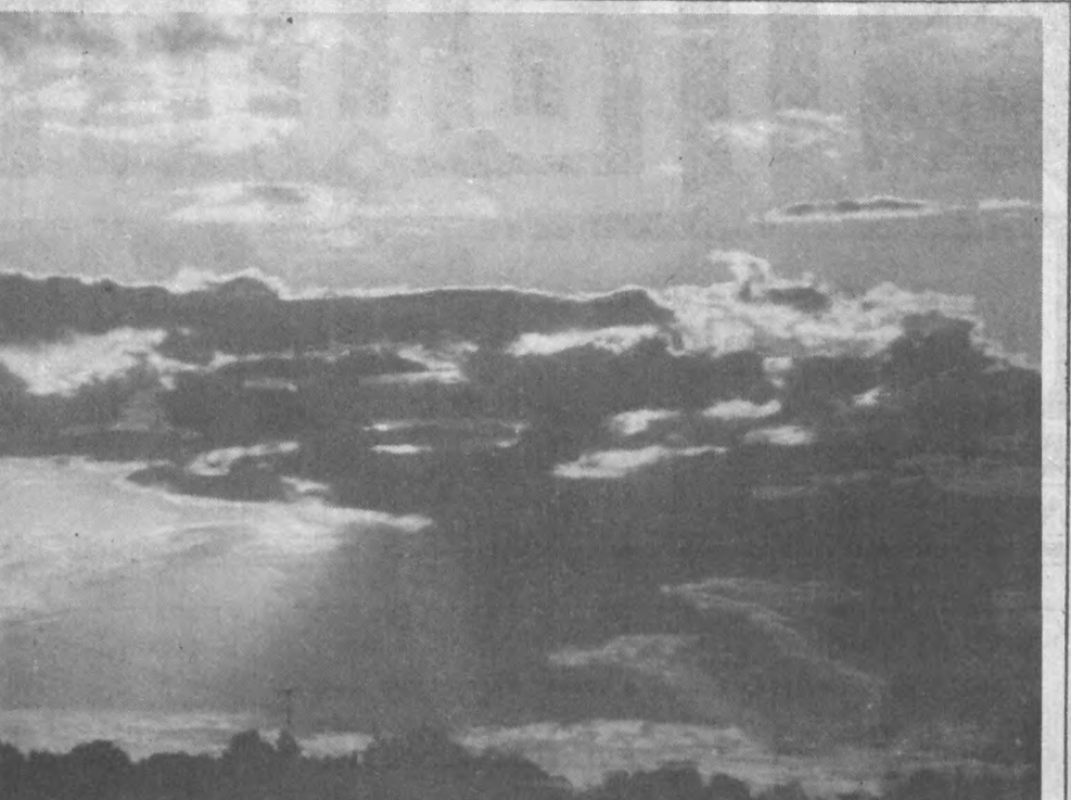
Улкамиз тоғи ана шундай гўзал.

«Иссиқ» ва «совуқ» ту- шунчалари ҳозир «ҳаро- рат» билан алмашти- рилган бўлсада, қадим- ги замон олимларининг бу соҳадаги башорат- лари бутунги фан учун асос бўлиб қолмоқда. Анбар АЛИЕВ тайёрлаган.