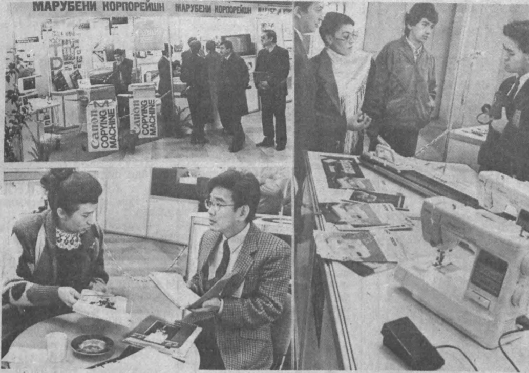
МАРУБЕНИ КОРПОРЕЙШН... аппаратлари, тикув машина...

«Узэкспомарказ»да Тич океани минтағаси кўрғазмалар уюштириш комитети билан ҳамкорликда «Тошкент-93» халқаро кўрғазмаси ўз ишнин якувлади.