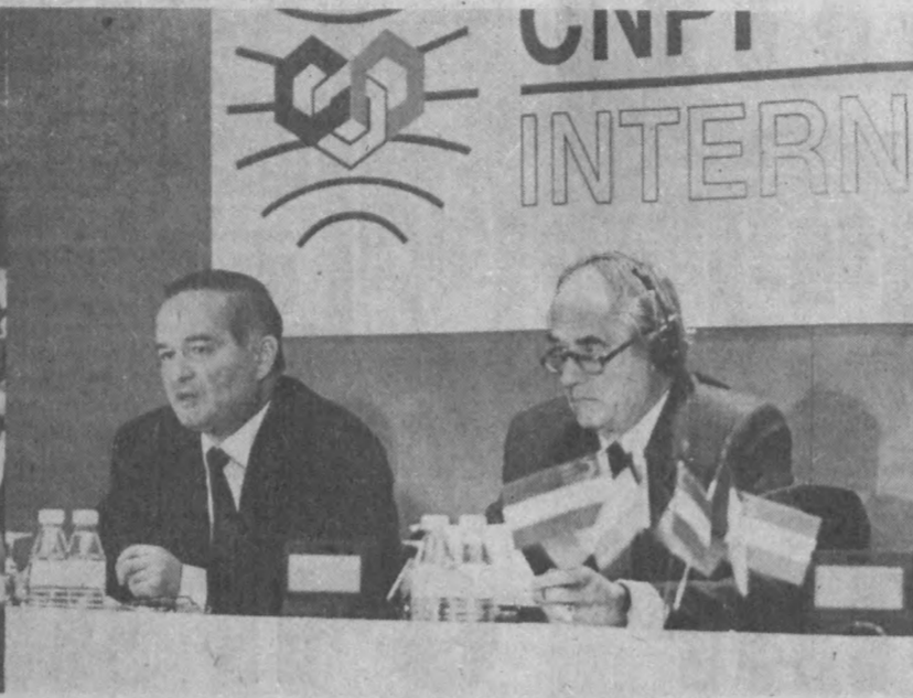
СУРАТДА: Ўзбекистон Президентини Ислам Каримов билан Франция ишбилармонлар кенгаши вице-президенти Филипп Жискард Эстен Франция ишбилармонлар доиралари вакиллари билан учрашув пайтида.