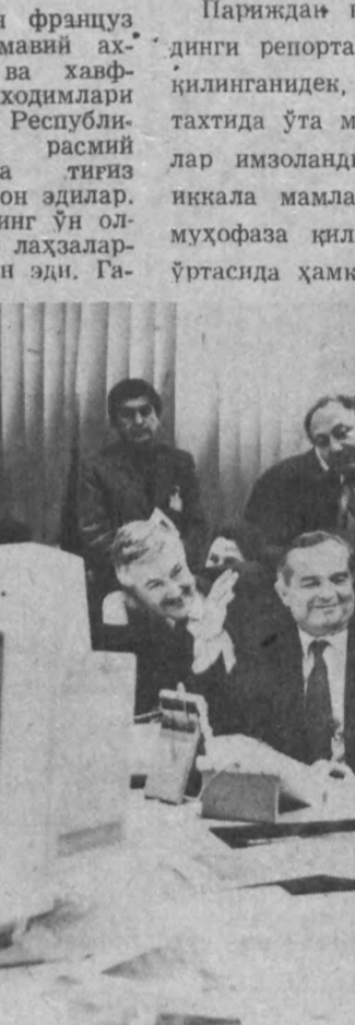
СУРАТЛАРДА: 1. Париж мэригидаги учрашув пайти.