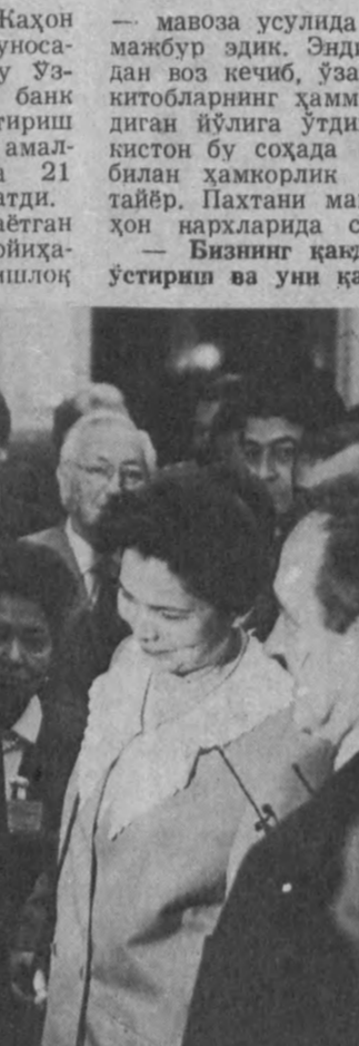
2. «Дассо» самолётсозлик компаниясига таширф чоғи.