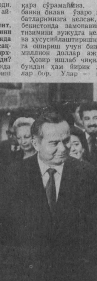
СУРАТЛАРДА: 1. Париж мэригидаги учрашув пайти.