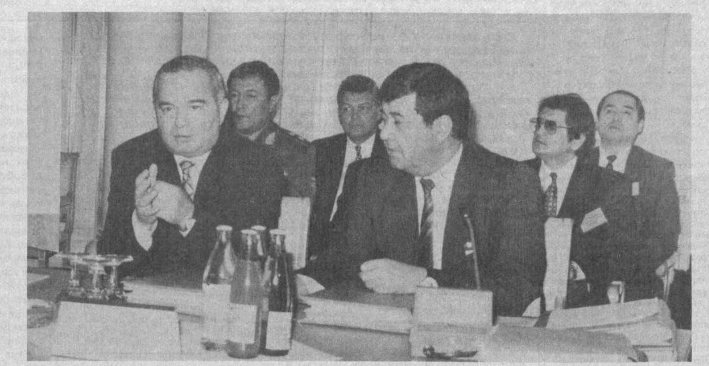
СУРАТДА: учрашув пайти.

10 февраль куни Қозоғистон пойтахти Алматы шаҳрида Мустақил Давлатлар Ҳамдустлигига аъзо мамлакатлар давлат ва ҳукумат бошқалиқларининг навбатдаги учрашуви бўлиб ўтди. Унда Ҳамдустликдаги 12 мамлакат делегациялари иштирок этди. Ўзбекистон Президенти Ислам Каримов Алматы аэропортида журналистлар саволларига жавоб бераётган экан, МДХ доирасидаги интеграция давр талаби эканини яна бир бор таъкидлади. Бу муҳим учрашувда қатнашиш учун барча мамлакатлар делегациялари Алматыга бир кун аввал ташриф буюрдилар. 9 февраль куни Қозоғистон пойтахтидаги Дустлик уйида Ҳамдустликка аъзо мамлакатлар Ташқи ишлар ва Мудофаа вазирлари кенгашларининг мажлиси бўлиб ўтди. Унинг иштирокчилари олий даражадаги учрашувда қўрилган масалалар юзасидан яна бир қарра фикрлашиб олдилар. Алматыдаги асосий воқеалар 10 февраль куни бўлиб ўтди. Қозоғистон Президенти саройида МДХга аъзо мамлакатлар давлат раҳбарлари кенгаши иш бошлади. Унда МДХ ҳудудда тинчлик ва барқарорликни қўллаб-қувватлаш, Ҳамдустлик доирасида умумий илмий муҳити тиклаш ва сақлаб қолиш чора-тад-