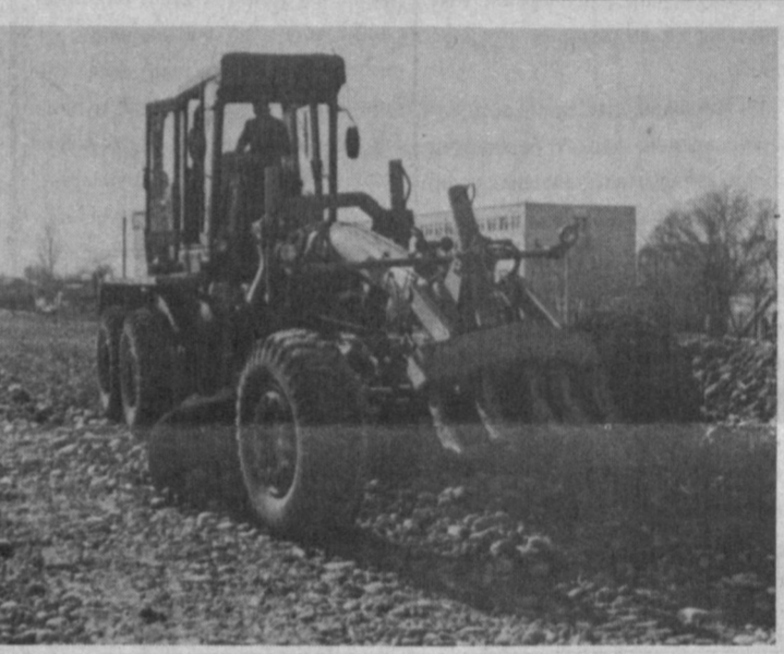
Хулоса, орадан ана бир оз мuddат утади. Юртимизга кириб келаятган ешлик, яларини ва гузаллик байрами Навруз айемида йўлсозлар ёруг юз билан транспорт қатнови учун муҳим булган бу йўлни ҳамшаҳарларимиз хизматига топширишади.

Экспозициялардан бирига куйдаги сузалар битилган: «Улар Ростсельмаш»ни кўридилар. Шу ерда меҳнат қилдиларди». Завод қорпусларини Тошкентда бунёд этиб, барча билан баробар галаба йўлида жонбозлик қўрашдилар, энг оғир дамларда завод ускуналарини кучириб, эвакуацияга тайёрлаган ҳам, уни Тошкентда монтаж қилган ҳам, корхона пойдоворига