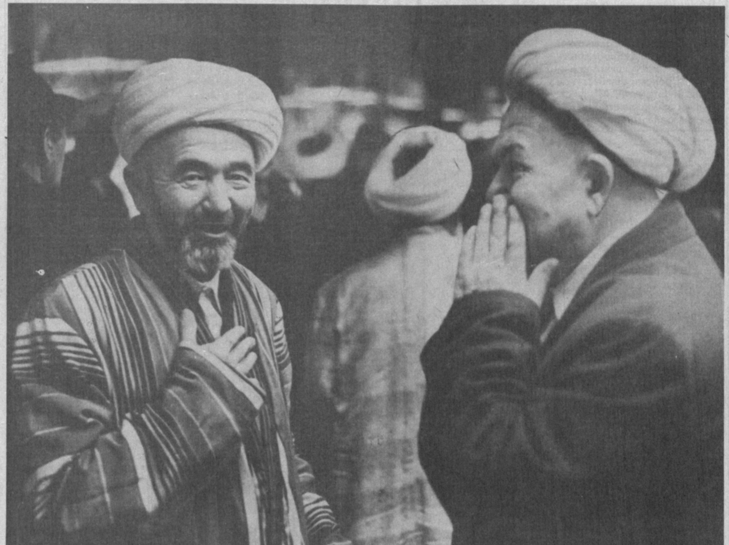
Отагонларимиз бор жойда ҳамиша шукроналик бор, иймону эътиқод ҳақида ибратли сўбатлар бор. Шу сабаб ҳам халқимиз «Оталар сўзи — ақлнинг кузи» деб айтадилар.