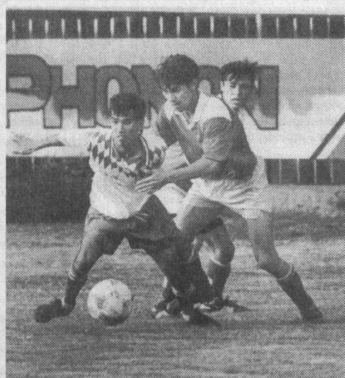
тўп сурайдиган бўлди.

«Чилонзор» командасининг биринчи табақа доирасидаги довуғини эшитиб, жамоа аъзолари билан учрашгимиз келди. Сўраб, суриштириб «Чилонзор» савдо маркази рўпарасидаги ўйингоҳга келдик. Тасодифи қарангли бу — бир пайтлар ўзимиз тўп тепадиган «Курувчи» ўйингоҳи эди. Майдон таниб бўлмас даражада ўзгариб кетган. Қайта таъмирланган майдонда меҳрли кўларнинг меҳнати шундоқ сезилиб турибди. Тўри, ўриндиқлар оз эди. Бироқ, муҳими бу эмас. Катта, гажмуқ ўйингоҳдаги зерикари ўйиндан, манашу эрдаги чиройли ўйин афзал. Футбол клуби мазмурутига кириб бордик. Янги, шинма бино. Ётоқхона, ошхона, тиббиёт хонаси. Жамоанинг олий табақага чиқиси аниқ