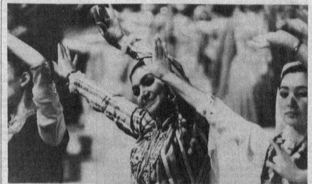
Санъат, у каттами-кичикми барчани ўзига бирдай мафтун этади. У рақсми, аскиями, кўшиқми — бир хилда жозибадор.