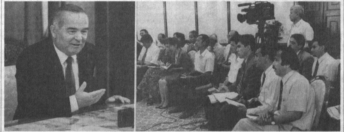
Ўзбекистон Республикаси Президенти Ислам Каримов 7 сентябрь кун «Буюк ипак йўли»ни қайта тиклашга бағишланган халқаро конференцияда иштирок этиш учун Озарбойжон пойтахти — Бокуга жўнаб кетиш олдидан журналистлар билан суҳбатлашди.

нинг буромоди бўлиши керак. Агар буромад даромаддан кўп бўлса, бу ҳам инкирозга олиб келади. Аввало, даромад берувчи тармоқларнинг тараққиётини таъминлаш керак.