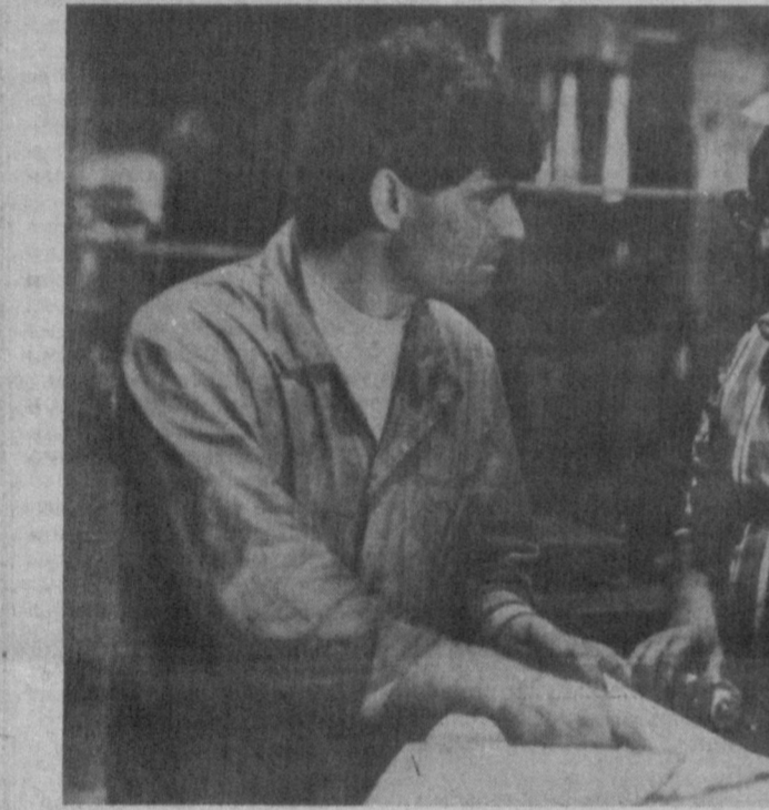
Излаган имкон топар