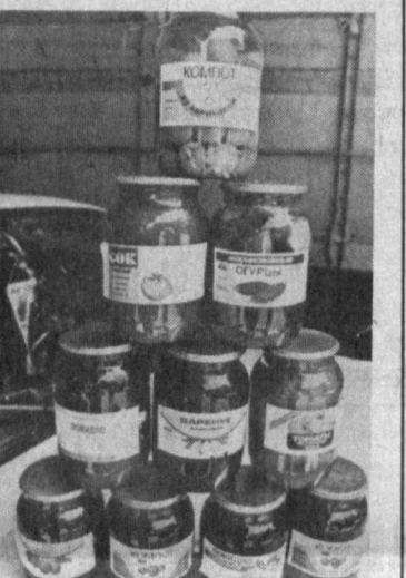
Шаҳримизда утаётган қишлоқ хўжалик маҳсулотлари савдо-ярмаркасида.