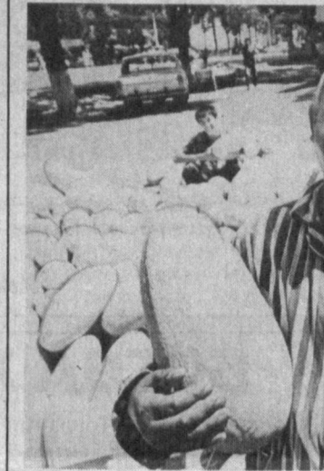
Шаҳримизда утаётган қишлоқ хўжалик маҳсулотлари савдо-ярмаркасида.

Бу хусусда гап борганда туманининг Гуломмаҳмуд Абдулаев номи жамоа хўжалиги аъзоларининг бизга қўрсатаётган ҳимматини алоҳида таъкидламоқ жоиз. Хўжалик раҳбарияти билан тузган шартномамизда мувофиқ улар қилин-қизин бозоримизни мева-сабзавотлар билан тулдир қилиб туришибди. Қолаверса жамоа бозорга яқин булдани учун унинг аъзолари ҳам уз томорқалариди ештирилган ҳосилини шу ерда сотишди. Бир суз билан айтганда, Тошкентимизга туташ булган бу жамоанинг йил сайин ҳамшаҳарларимизга қўрсатаётган савоати ортиб бормоқда.