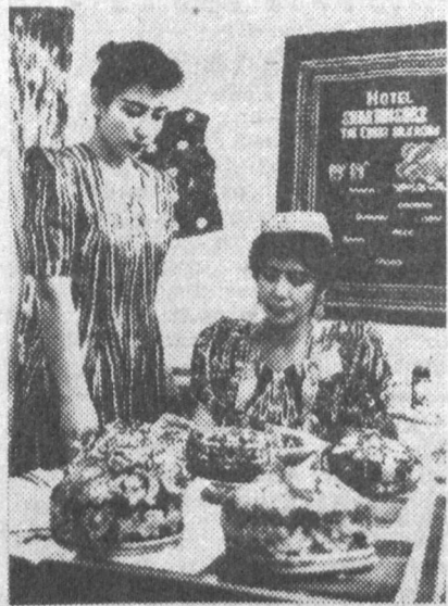
Юртимизнинг қайси бурчагига борманг ўзига хос, ўзига мос, ҳайратомуз мўъжизаларга дуч келасиз. Аслида бу мўъжиза бизга эрта тонгдан то кечгача ҳамроҳ бўлади. Аслида бу мўъжиза қўли гул устазодаларнинг ўлмас ижоди.

Энг эътиборли жойи Хива кулочилиги. Риштон кулочилигига, Тошкент чинниси Самарқанд чиннисига асло ўхшамайди, бир-бирини тақроқламайди. Ҳар бири уста ўзи яшаб турган воҳа табиатининг гузаллигини, санъатини лағанд, пиёла, қосаю ликобчаларда акс эттиради.