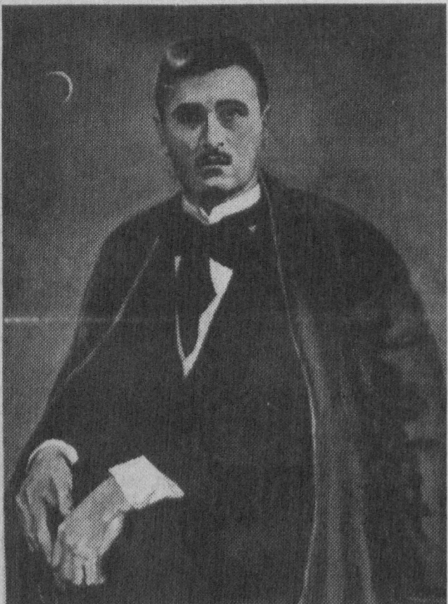
Мусаввира Азиза Маматованинг «Чўлпон» суратидан кўчирма.