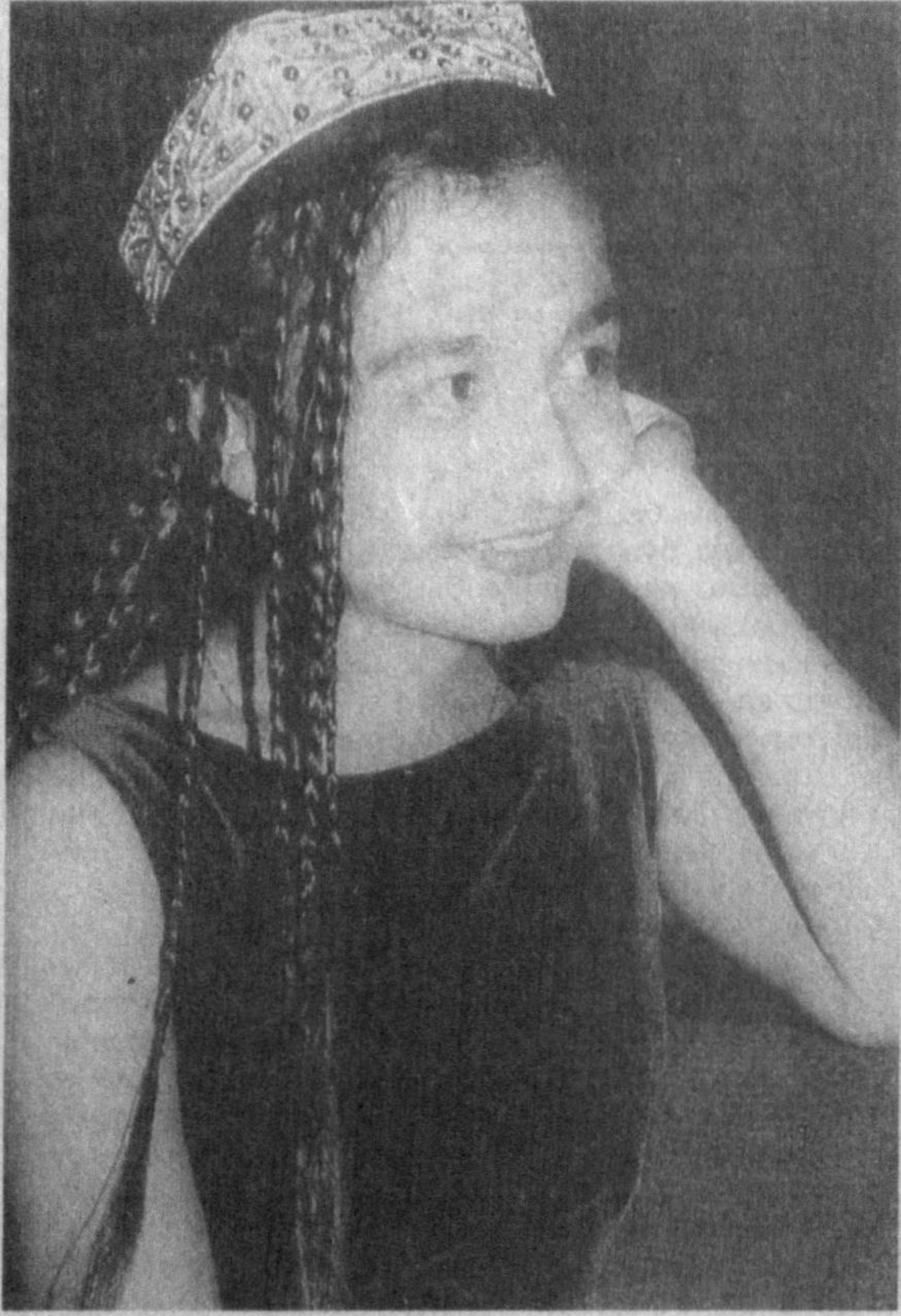
Қирк кокили ўзига ярашур.