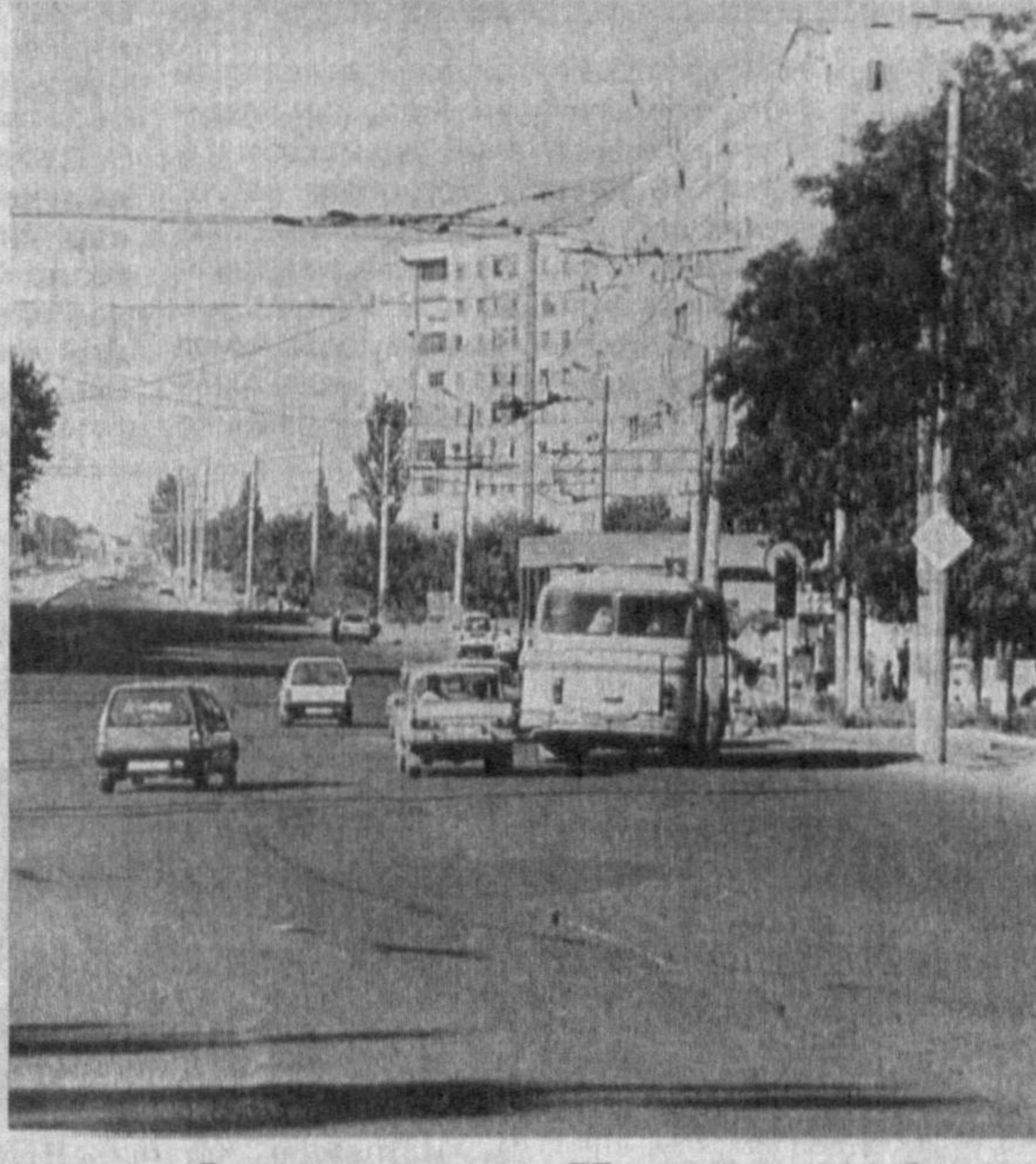
«Оқшом»нинг «Ишонч телефони»