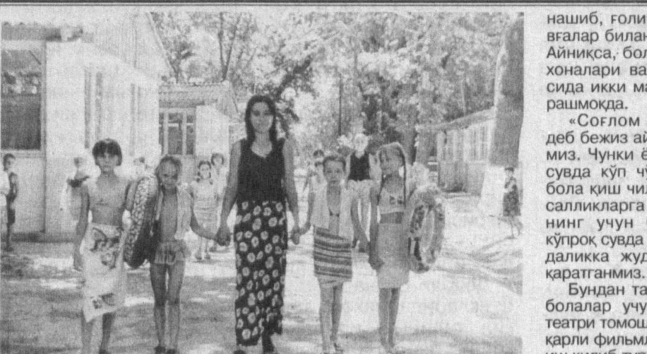
Ёз — ўтмоқда соз

◆ Кеча Миср халқи миллий байрам — Мустақиллик кунини нишонланди.