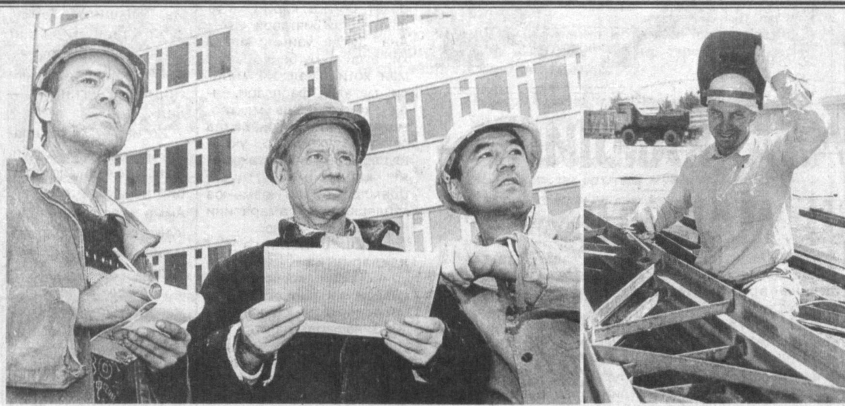
Мустақиллик байрамига шаҳримиз қурувчилари ҳам муносиб ҳозирлик кўришмоқда. Уларнинг сўй-ҳаракатлари билан кўп қаватли уйлар, маданий-маиший мажмуалар, замонавий кўприклар, кенг ва равоқ кўчалар қад ростлашмоқда. СУРАТЛАРДА: Тошкент қурилишларида фаол қатнашган бунёдкорлардан бир гуруҳини кўриб турибсиз.