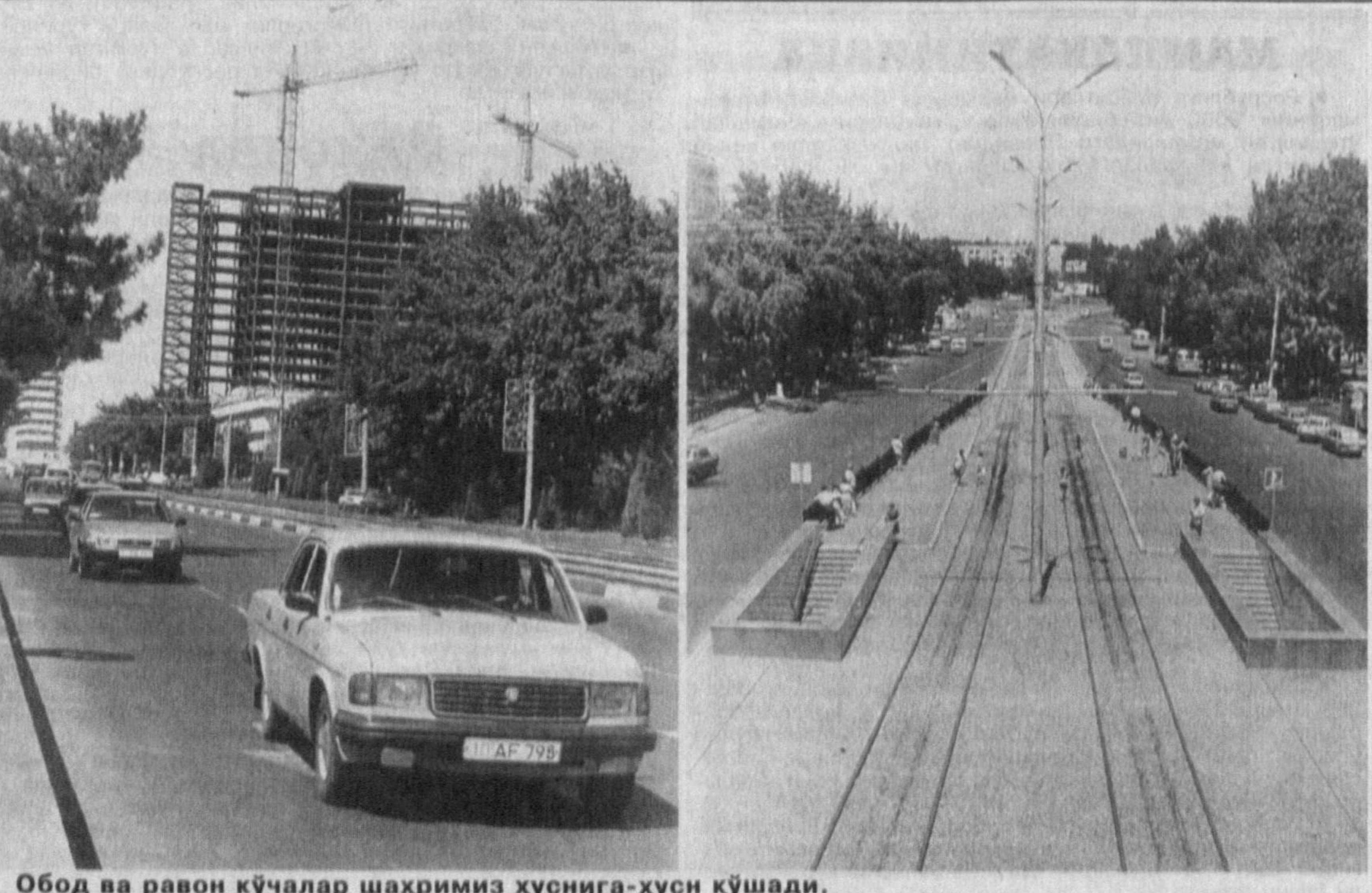
Обод ва раво кўчалар шахримиз хусниға-хусн қўшади.

Ҳеч мулобағасуз айтиш мумкинки, уюлиб ётган бу чиқиндилар шахримиз хусусиға доғдир. Ахир, ота-боболаримиздан қолган эски, қадимий, ибратли удуларимиз қайқача кетди? Маълумки, жойларда озодагарчилик, тозаллик, саранжом-сарийшталликка эътибор беришда айқунларимиз қайқача кетди? Маълумки, жойларда озодагарчилик, тозаллик, саранжом-сарийшталликка эътибор беришда айқунларимиз қайқача кетди? Маълумки, жойларда озодагарчилик, тозаллик, саранжом-сарийшталликка эътибор беришда айқунларимиз қайқача кетди?